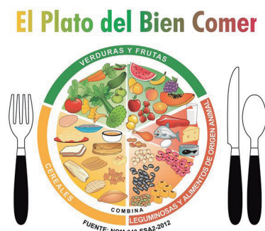
Figura 1. Guía de orientación alimentaria mexicana.

En 2012, se publicó la Encuesta Nacional de Salud y Nutrición (ENSANUT). Los resultados revelaron que los mexicanos están inmersos en un proceso de transición del estado de nutrición; es decir, por un lado, se observó que el 73% de la población en zonas