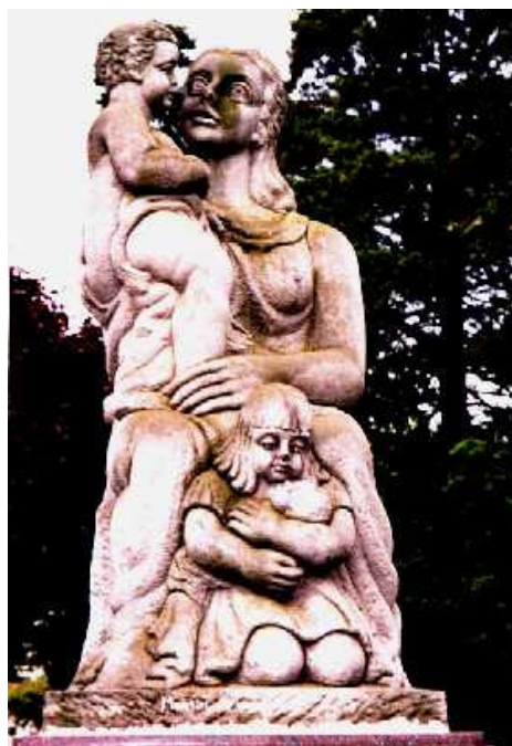
Figura 2: Monumento al año de la limpieza: se observan las manchas amarillas de las colonias de líquenes

b) Limpieza de material cementíceo: en dos años de exposición a la intemperie, los trozos de material lavados permanecen sin signos de recolonización.