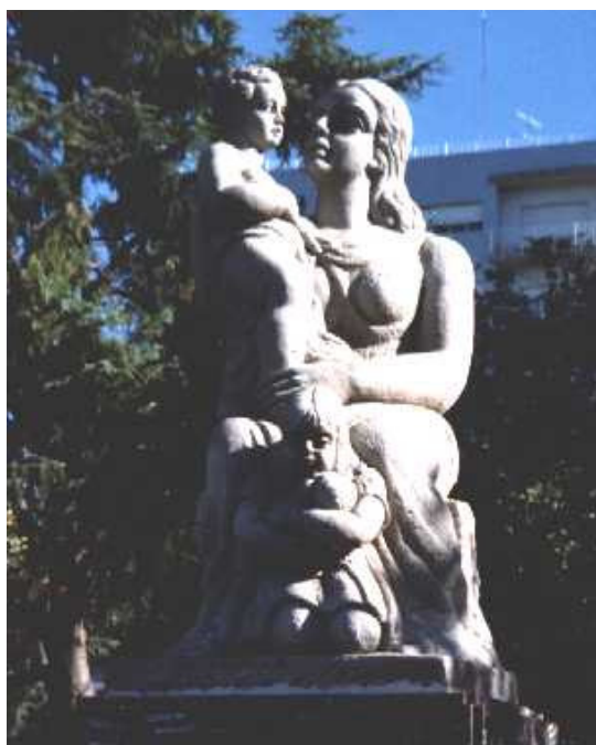
Figura 1: Monumento a la Madre, Olavarría, luego de la limpieza