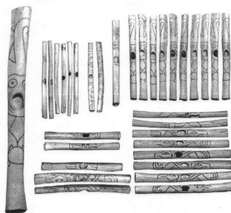
Figura 5: Flautas