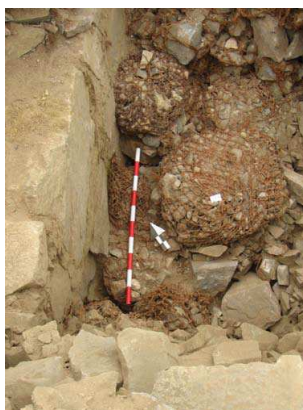
Figura 6: Shicras con piedras

En los edificios piramidales públicos, las terrazas tuvieron muros con mortero de arcilla y pachillas o piedras de menores dimensiones de “shicras” con piedras, que cumplían una función estructural (figura 6). Hasta el período Medio, algunos edificios públicos mantuvieron recintos de palos, cañas y barro. En el período Medio Tardío se generalizó el uso de bloques de piedra cortados. En el caso de las viviendas, en los primeros períodos, fue construido con muros de armazón vegetal, hechos con palos de sauce, huarangos y caña brava (figura 7). En el período Medio utilizaron piedras cortadas de granodiorita, con argamasa de barro.