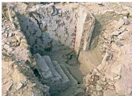
Figura 7: Construcción de paredes con quincha