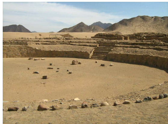
Figura 12: Templo del Anfiteatro