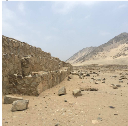
Figura 10: Pirámide Menor 02