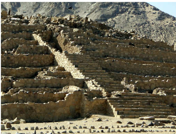
Figura 11: Pirámide de la Galería