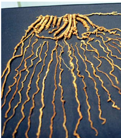
Figura 4: Quipu de algodón

Trabajaron en la manipulación genética de algunas plantas sea de uso medicinal como alimenticio y de insumo en la construcción, cuerdas, lienzos, amalgamas etc., permitiendo que la producción sea de mejor calidad y tamaño, y con mayor resistencia a las plagas, especialmente en el caso del algodón. Como testimonio del intercambio interregional se encuentra el uso de una fibra Cachay usada como combustible vegetal.