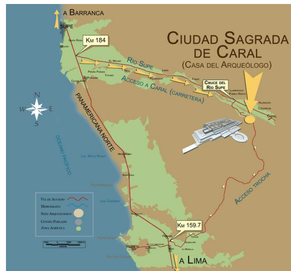
Figura 2: Ubicación regional