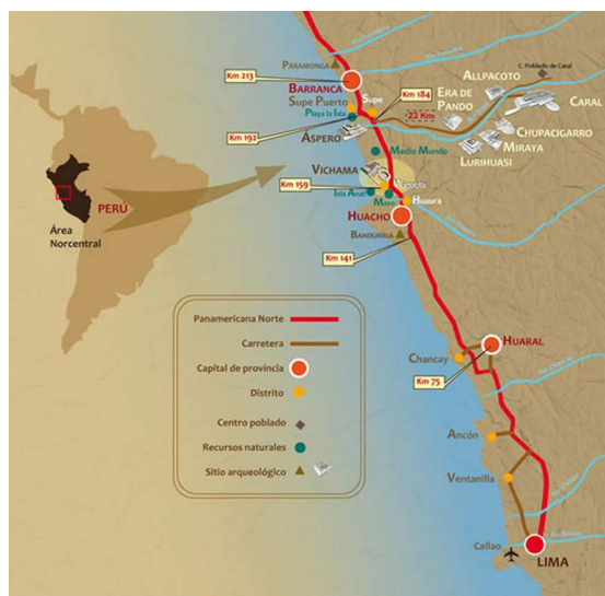
Figura 1: Ubicación relativa

Se desarrolló a orillas del río Supe como se muestra en detalle en la figura 2 en relación a su ubicación regional actual a través del Valle de Supe.