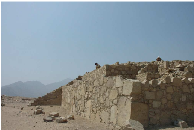
Figura 9: Pirámide Menor 01