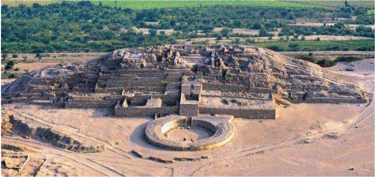
Figura 8: Pirámide Mayor

La Ciudad Sagrada de Caral presenta una estructura urbana característica, sus principales edificios: Edificio Piramidales: Mayor (figura 8); Menor (figuras 9 y 10); La Galería (figura 11); de la Huanca; La Cantera y la Central, también contaba con Plazas, Templo del Anfiteatro (figura 12), y residencias.