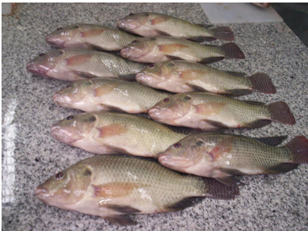
Figura 4. Ejemplares de tilapia nilótica cosechados al finalizar la experiencia.

El alimento utilizado fue un balanceado seco con un 30% de proteína bruta que se suministró diariamente en seis raciones, determinadas de acuerdo a la biomasa existente en el tanque y por tablas de alimentación. (Mallo, et al , en prensa).