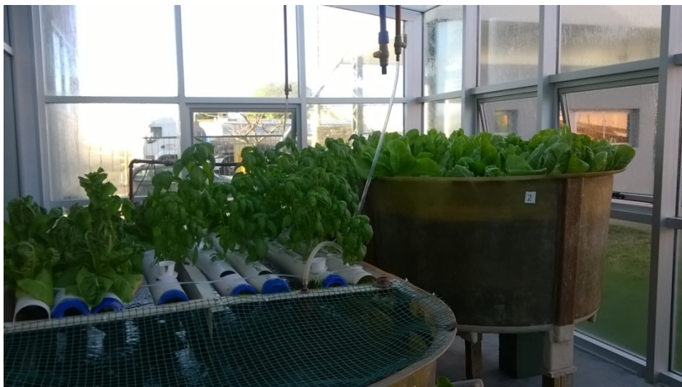
Figura 3 . Cosecha de lechugas y albahacas en el Sistema de Balsas y NFT.