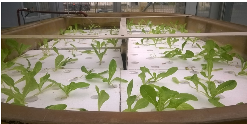
Figura 2. Sistema de balsas con plantines de lechuga criolla sembrados.

Con respecto a los vegetales, fueron plantados de semilla en la Unidad Académica Mar del Plata. Las mismas se colocaron a germinar en un recipiente con tierra. Una vez germinada, al llegar el plantín a un mínimo de cinco hojas verdaderas se procedió a lavar las raíces para luego trasladarlas a los sistemas de balsas y NFT. (Figura 2)