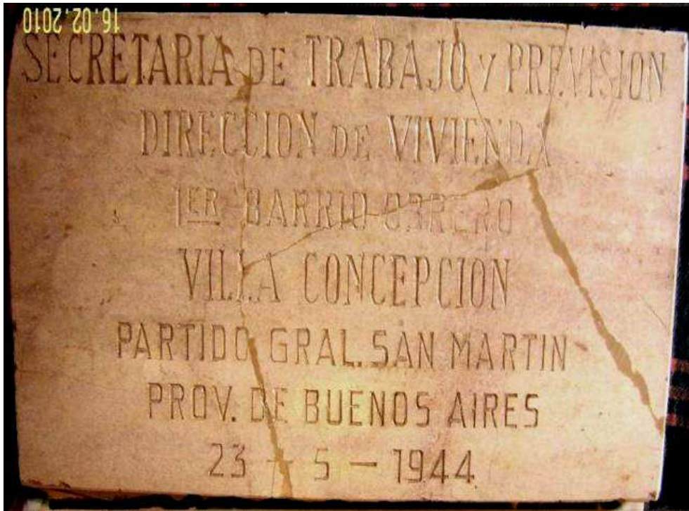
Figura 22. Placa previa al tratamiento.