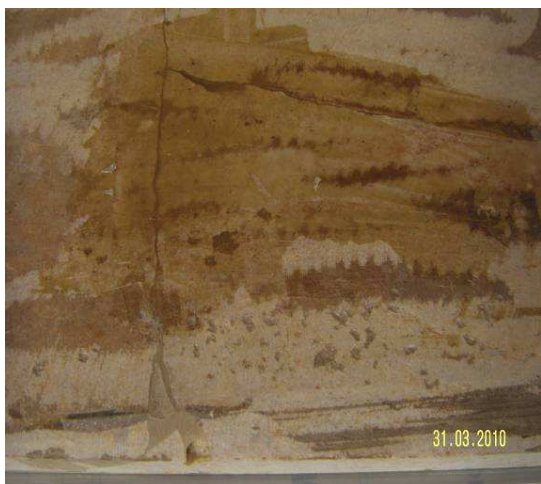
Figura 3. Abrasión de la superficie producida por discos de desbaste de forma circular.