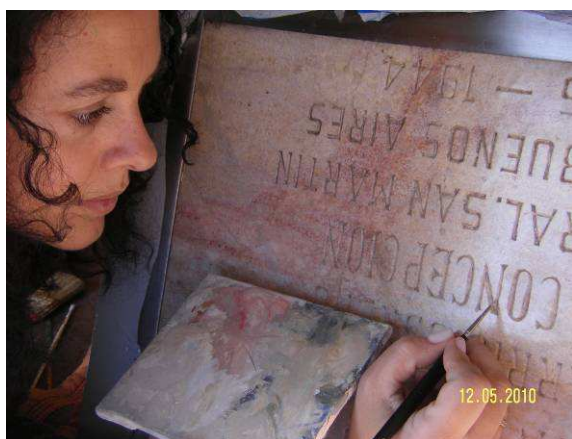
Figura 9. Integración cromática de color original.