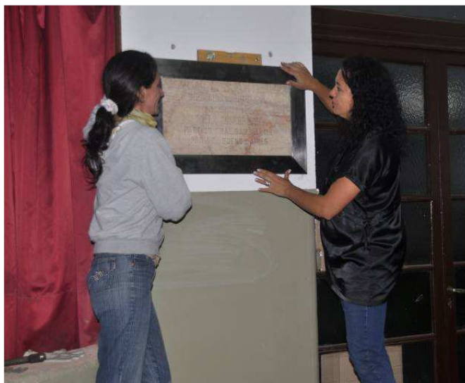
Figura 19. Toma de nivel para la fijación definitiva de la placa.