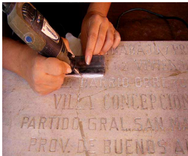
Figura 8. Eliminación de material de relleno con torno de punta de diamante.