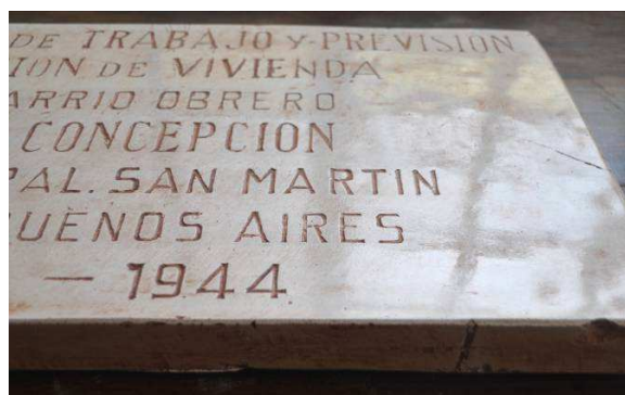
Figuras 13 y 14. Reproducciones realizadas con cemento blanco y fibras de polipropileno. Pátina fina, protección filmógena y obtención de brillo.