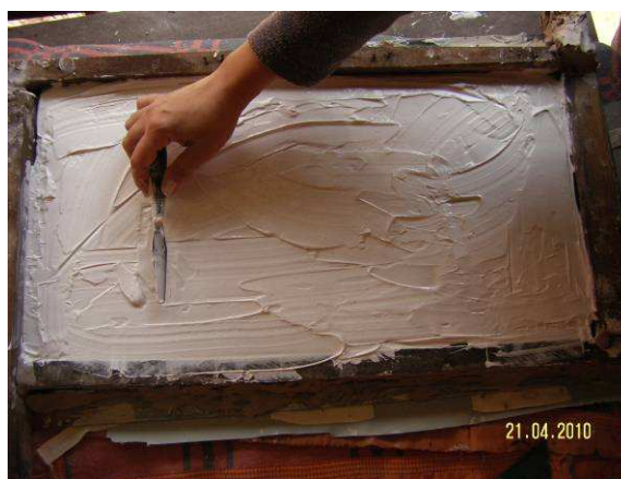
Figura 10. Proceso de realización de molde para la reproducción de la placa.