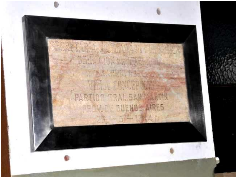
Figura 23. Placa post tratamiento de conservación y restauración. La foto se tomó sin la protección de acrílico para no distorsionar detalles del mármol.