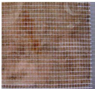
Figura 6. Malla de fibra de vidrio.