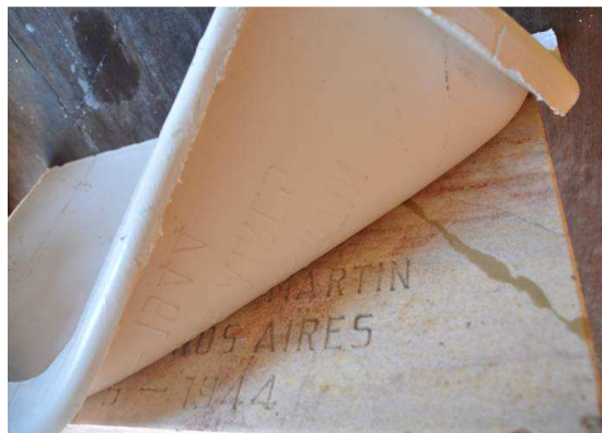
Figuras 11 y 12. Contra molde realizado en yeso y molde de caucho de silicona.