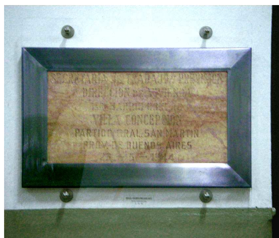
Figura 21. Acrílico protector – Proceso total finalizado.