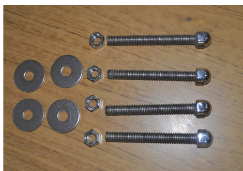
Figura 18. Pernos roscados de acero inoxidable AISI 304, con arandelas, tornillos y tuercas del mismo material.