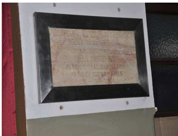
Figura 20. Placa amurada.