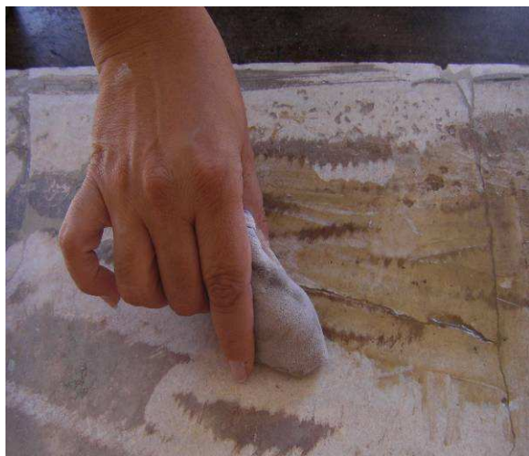
Figura 7. Eliminación de suciedad con muñeca de trapo.