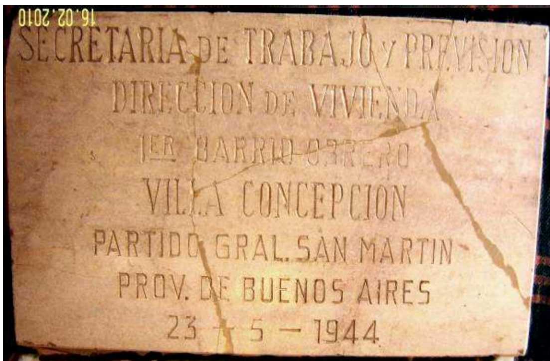
Figura 2. Imagen de la placa, previa al proceso de restauración.