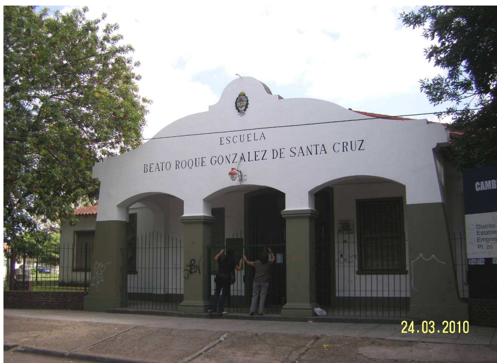
Figura 1. Escuela n° 48, ubicada en el casco histórico del barrio de Villa Concepción.

El 25 de mayo de 2010 los miembros de la comunidad de Villa Concepción, miembros del Honorable Concejo Deliberante de General San Martín y quienes somos responsables del tratamiento de conservación y restauración, realizamos el emplazamiento de la piedra fundamental en la escuela n° 48, ubicada en el casco histórico del barrio de Villa Concepción. (Ver figura 1.)