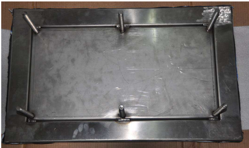
Figura 16. Pernos roscados de 10 mm de diámetro de acero inoxidable.

Finalmente se diseñó una protección con acrílico transparente para preservar la estructura física del mármol ya sujeto al muro con pernos roscados 10 mm de diámetro, de acero inoxidable AISI 304, con arandelas, tornillos y tuercas del mismo material (figuras 17 y 18).