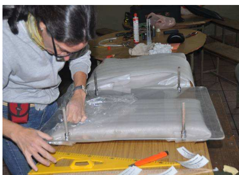
Figura 17. Protección con acrílico transparente.

Finalmente se diseñó una protección con acrílico transparente para preservar la estructura física del mármol ya sujeto al muro con pernos roscados 10 mm de diámetro, de acero inoxidable AISI 304, con arandelas, tornillos y tuercas del mismo material (figuras 17 y 18).