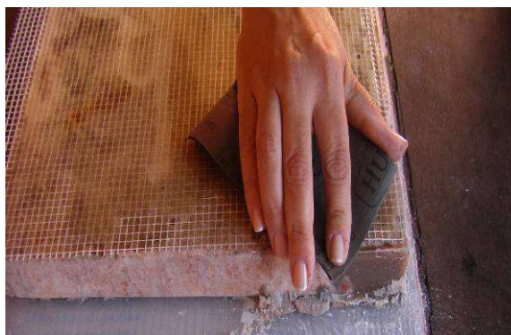
Figura 5. Integración de faltantes de material original.