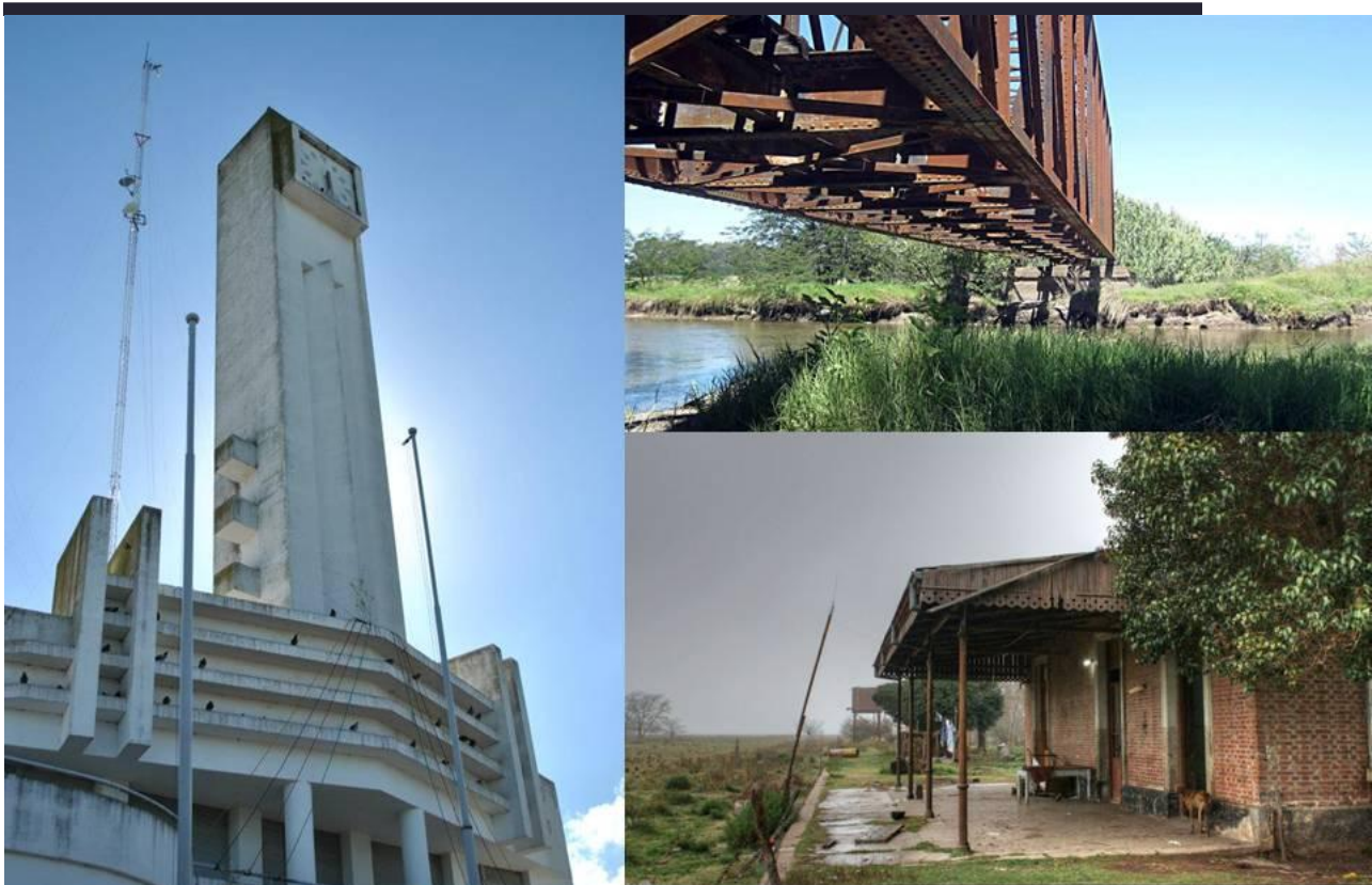
Arquitectura patrimonial de los pueblos de la región NOBA.