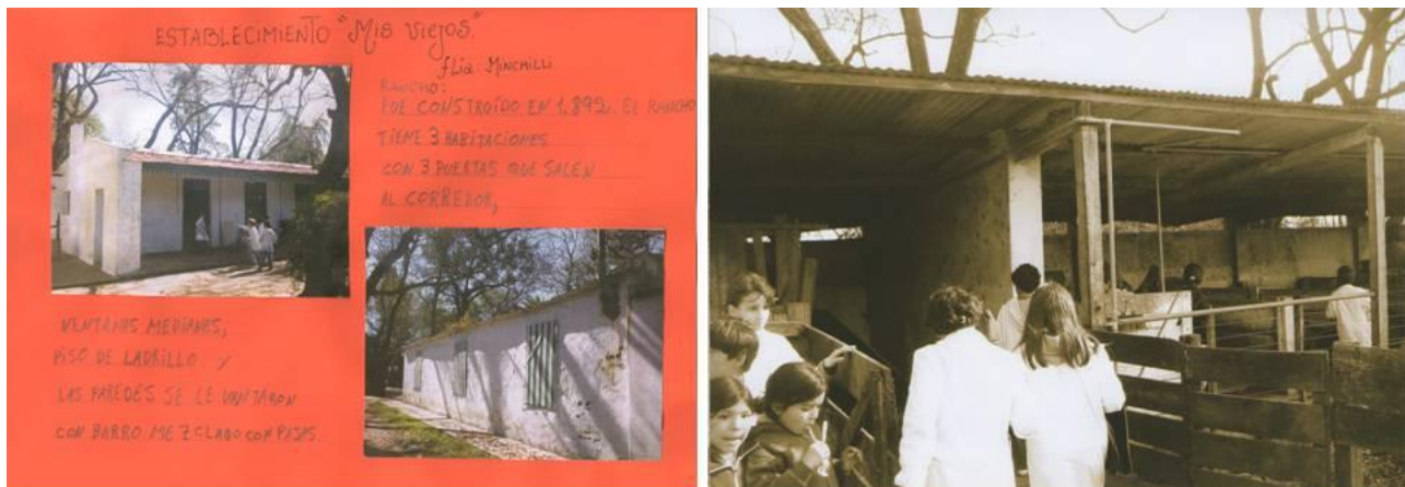
Trabajos de las escuelas rurales sobre visitas a las estancias de su localidad (2010).

Si bien todos los directores de las 38 escuelas públicas de Chacabuco recibieron las orientaciones y sugerencias pertinentes, según las necesidades específicas, no todos los establecimientos realizaron proyectos con este tipo de enfoque [8]. No se tiene conocimiento sobre la realización de proyectos de esta naturaleza en otros partidos de la provincia, pero se sabe que durante el presente año la Escuela Privada Madrigal, inició un proyecto semejante en el que visitarán la Estancia La Criolla, lugar donde comenzó a funcionar el primer Juzgado de Paz de Chacabuco