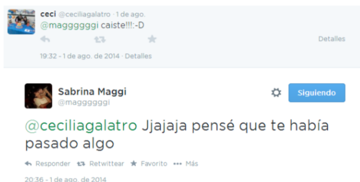
Imagen 12. Captura del timeline de @Maggggggi.

Para las y los jóvenes entrevistados, las menciones no representan algo distinto de lo que puede entenderse por su nombre, no se perciben otros sentidos atribuidos a las mismas; pero sí encontramos en las prácticas que no todas y todos las utilizan del mismo modo y se vuelve primordial quién es el usuario con quien interactúan. De esta forma, a veces se torna difícil comprender desde dónde provienen las menciones reconvertidas en charlas porque, en tanto lectores, nos falta información que puede provenir de lo offline, desde otras redes sociales digitales o que no se interprete porque comparten un mismo código juvenil. “En Twitter nos relacionamos mucho el grupo de amigos”, sostiene @Maggggggi.