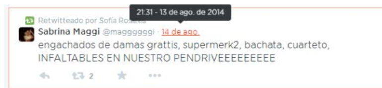
Imagen 6. Captura del timeline de @RosalesSoffia.

Lo harían porque comparten también. Yo creo que el retuit es compartir, aunque no sabría cómo explicarte en realidad. (@RosalesSoffia)