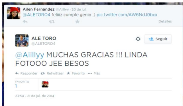
Imagen 7. Captura del timeline de @Aiillyy

Cuando capaz estoy interesado en una persona y veo algo que tuiteó para otra persona capaz que le doy favorito también, como para que sepa que también lo vi. (@leoalvesdebrito)