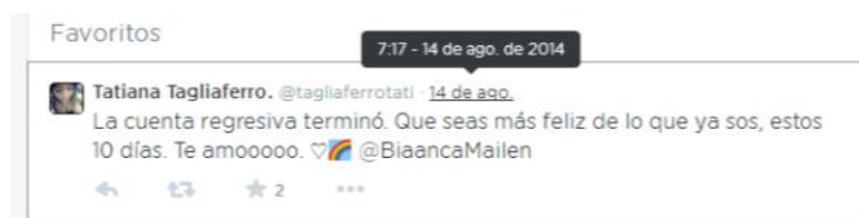
Imagen 8. Captura de los favoritos de @BiancaMailen.