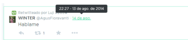
Imagen 3. Captura del timeline de @Luji_Ipda.

A su vez, estos y estas jóvenes retuitean conscientes de la huella que dejan en sus cuentas, haciéndose cargo de que esos retuits aparecen por ellos y ellas, aunque no los hayan escrito. Porque desde una lógica opuesta y más adultocrática, hay usuarios que se despegan de la opinión que puede formar un retuit, sentenciando que sólo sus tuits se pueden considerar como “propios”. Esto tiene que ver con otros sentidos atribuibles a un tuit al momento de retuitear: porque muestra información que el o la usuario consideró interesante o porque elige burlarse de un tuit y retuitearlo desde el sarcasmo. Aunque puede percibirse una interpelación –para que dos identidades (en este caso, usuarios) se articulen deben igualarse en algo, compartirlo– lo que queremos expresar es que el sentido de esos usos no es que estos y estas jóvenes muestran, por el contrario.