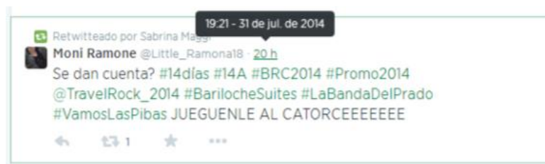
Imagen 9. Captura de los favoritos de @Magggggi.

Quando me parece algo copado, me divierte. Por eso está la diferencia. Yo al retuit lo siento más y al favorito me divierto más. (@RosalesSoffia)