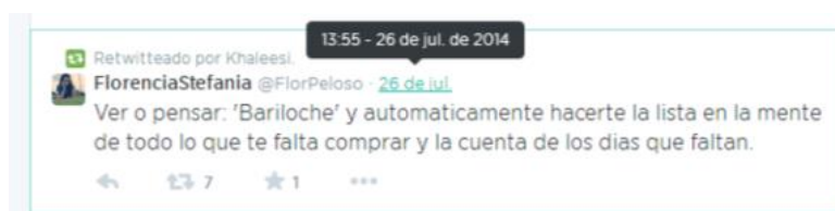
Imagen 4. Captura del timeline de @purple_stain_.

Asimismo, estos y estas jóvenes resaltan lo momentáneo y cómo Twitter puede articularse a eso que les sucede, que sienten y canalizarlo a través de esta red social. El retuit también tiene que ver con ese discurso que llega a sus ojos en un momento determinado y los y las interpela de modo tal que lo retuitean porque están sintiendo eso mismo en ese preciso instante.