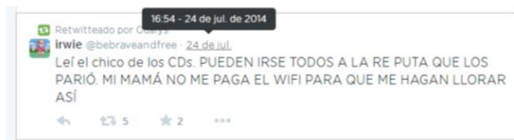
Imagen 2. Captura del timeline de @Odalys_Peralta.