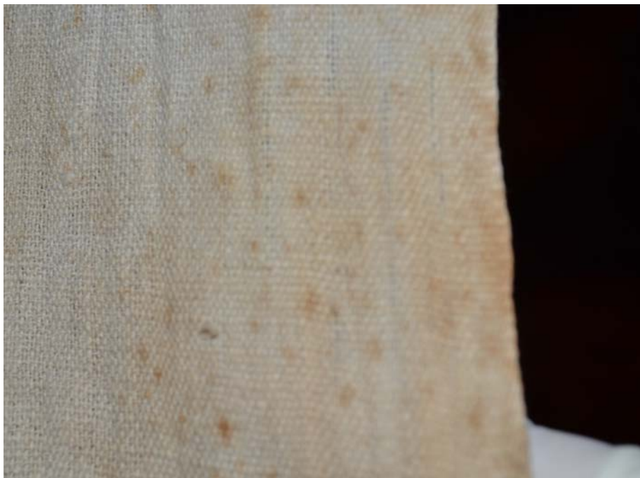
Imagen 3 - Vista general de la pieza n° 60177 en la que se observan manchas color café producto de la actividad metabólica de microorganismos.

El estudio de microscopía óptica realizado sobre algunos ejemplares del conjunto depositado en el Museo permitió relevar en detalle la organización del textil. Sobre ella se observó la presencia de estructuras biológicas oscuras alojadas en el interior de las fibras a consecuencia del desarrollo de hongos de la familia Dematiaceae.