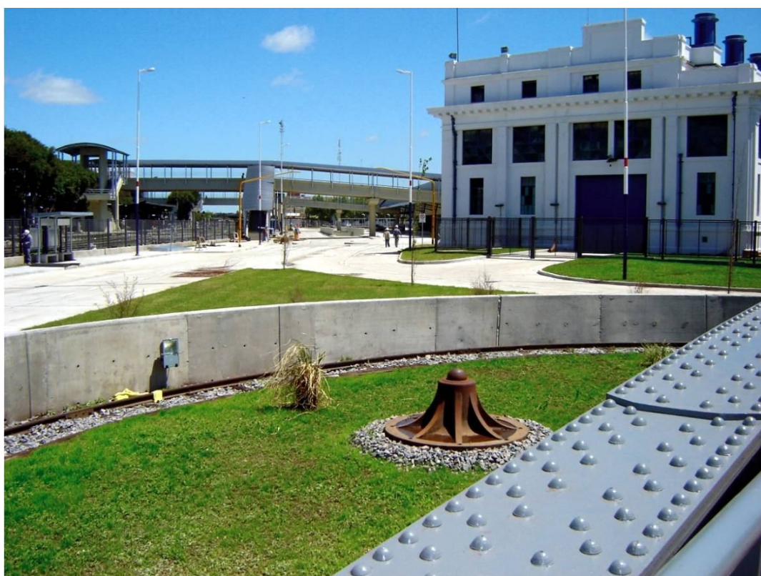
Fotografía 11. Puesta en valor del equipamiento urbano