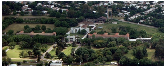
Fotografía 30. Vista aérea del conjunto edilicio y la forestación que la circunda

El edificio también está ocupado por otras instituciones educativas como el Profesorado Nacional de Educación Inicial y el Jardín de Infantes dependiente del mismo (ambos dependientes de la Dirección General de Escuelas de la Provincia de Buenos Aires) y también el Jardín Maternal "Kesachay", dependiente del Consejo del Menor y la Familia.