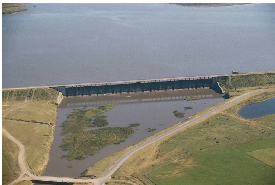
Fotografía 3. Camino de Sirga en la represa Roggero