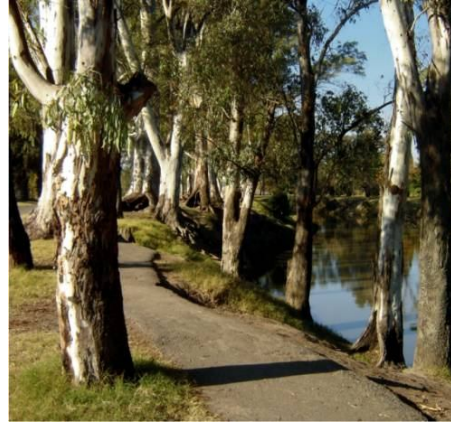
Fotografía 6. Bicisenda