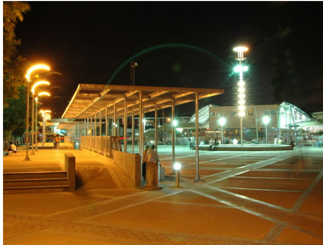
Fotografía 17. Centro de trasbordo, de noche