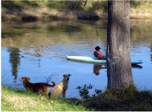
Fotografía 5. Aprovechamiento deportivo