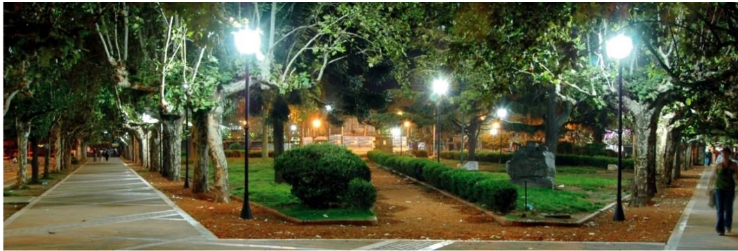
Fotografía 12. Mejoramiento de áreas verdes forestadas

Se constituye así en un centro estratégico para el desarrollo comercial y de servicios y un lugar de actividades culturales y de tiempo libre, por su localización de accesibilidad y por el incremento de pasajeros.