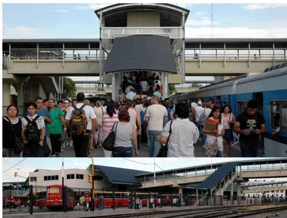
Fotografías 15 y 16. Seguridad en el trasbordo entre transportes