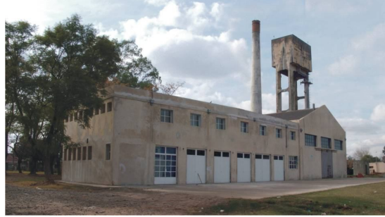
Fotografía 31. Antiguos talleres, refuncionalizados como Centro de Formación Profesional

Emplazado en un amplio predio de enorme valor paisajístico, el edificio se desarrolla sobre dos ejes de simetría que articulan los diversos sectores. Un eje como espina circulatoria sobre la que se organizan todas las unidades funcionales, desarrollado en 3 plantas superpuestas espejadas en relación al hall de acceso, en donde se encuentran los núcleos de dependencias administrativas, y otro eje perpendicular donde se desarrollan los sectores de servicio.