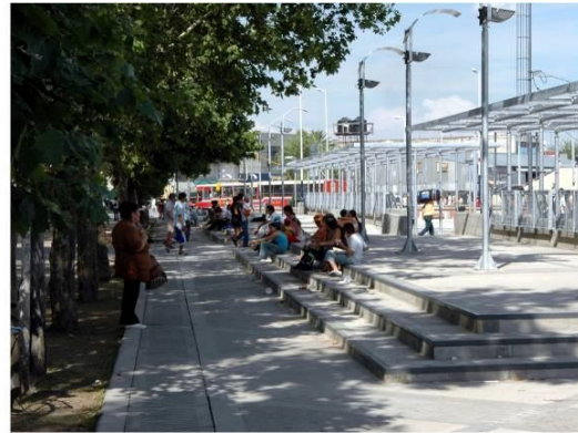
Fotografías 8 y 9. Espacios de recreación y encuentro

La renovación de la organización del sistema de transporte, empuja la reorganización de la zona central de la ciudad. Aprovechando la potencialidad de la infraestructura instalada, recuperando el rol del centro de la ciudad, con el objetivo explícito de recuperar la centralidad funcional del casco histórico. (ver fotografía 10)