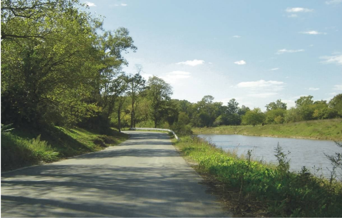
Fotografía 1. Camino de Sirga

Como objetivo fundamental se establece la recuperación de un área degradada de 20 km vinculando el Lago San Francisco con el sistema de parques ribereños del Camino del Buen Ayre, con logros en lo ambiental y lo urbano: