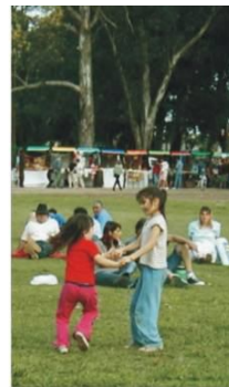
Parque de la familia

Gestiona intervenciones que integran economía, sociedad y cultura a través de la reutilización del patrimonio, como huellas de la manera en que la comunidad se fue apropiando del territorio.