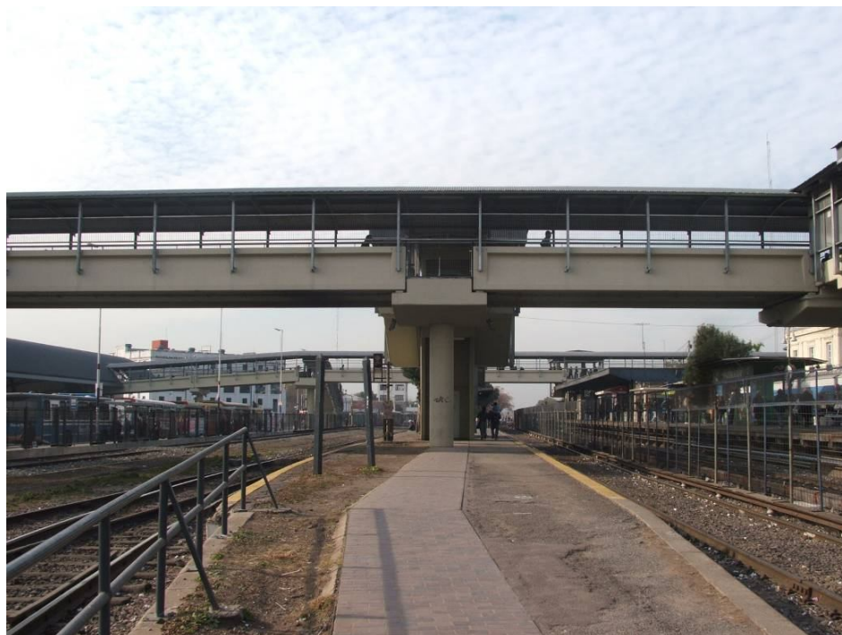
Fotografía 14. Cruces a desnivel. Conexión norte-sur