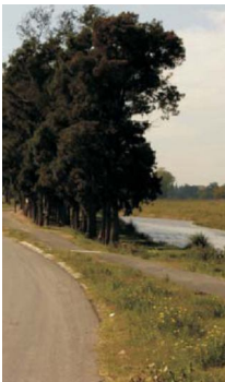
Camino de Sirga

Rescata y revaloriza el patrimonio ambiental y cultural local y regional, como movimiento que propone poner en valor aquellos espacios que reúnan valor arquitectónico, histórico o cultural, vinculado a su memoria e identidad. Rescate que pretende contribuir a un desarrollo local sustentable, favorecer el empleo, revitalizar los valores del patrimonio como instrumentos de identidad.