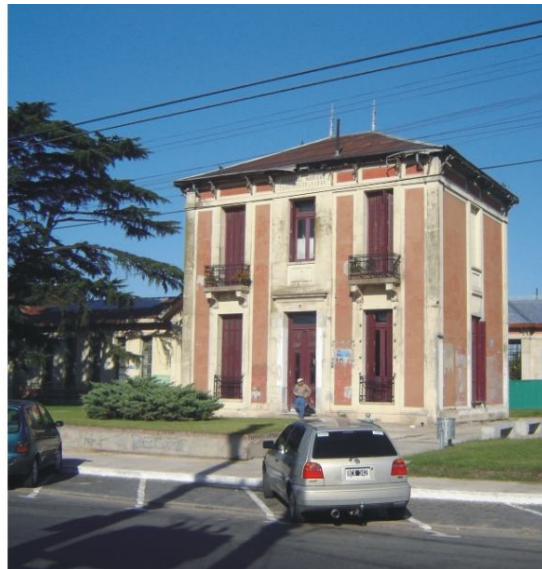
Fotografía 22. Acceso por Av. del Libertador