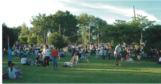
Fotografía 34. Amplias áreas de Esparcimiento y recreación

de las distintas regiones de nuestro país, en un clima familiar, de amistad y solidaridad. (ver fotografía 35)