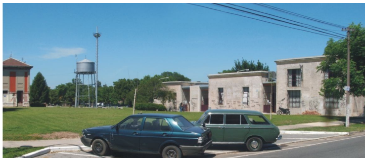
Fotografía 24. Pabellones de servicio refuncionalizados

Las intervenciones y alteraciones sufridas por el conjunto edilicio a lo largo de los años, están siendo superadas para recuperar sus valores históricos y artísticos, configurando una nueva centralidad y resignificando su relación con el entorno.