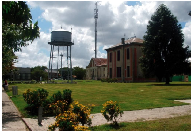
Fotografía 19. El tanque de agua y vista parcial del espacio verde recuperado

Este emprendimiento intenta crear un vínculo entre la sociedad y el territorio; afianzando la memoria, la pertenencia y la participación como componentes fundamentales del proyecto.