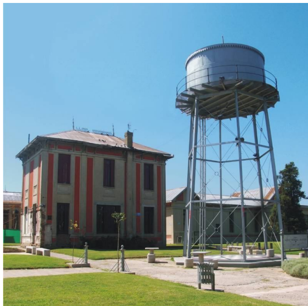
Fotografía 20. Equipamiento urbano y edificio sede del Iduar