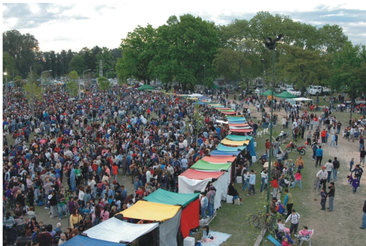
Fotografía 37. Feria artesanal con la concurrencia a espectáculos artísticos.

El éxito del Encuentro de las Provincias animó a organizar otros eventos como Moreno Tango, Esperando el 25, Carnavales, Primavera Rock, también con la filosofía de las fiestas populares y la participación activa de nuestro pueblo.