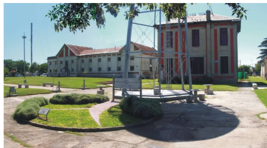
Fotografía 25. Cartelería y espacio lúdico