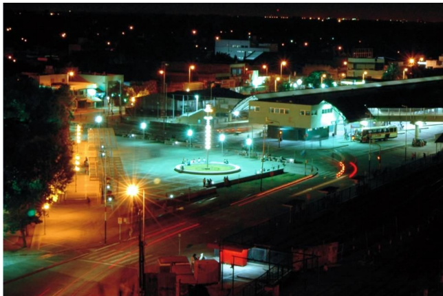
Fotografía 18. Nuevo atractivo en el espacio central