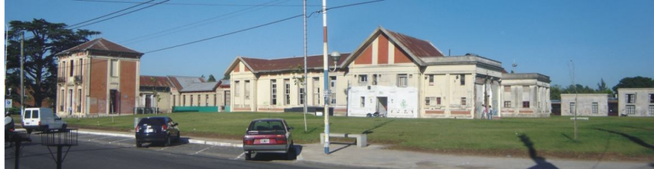
Fotografía 23. Dársenas de estacionamiento sobre la avenida principal

Mientras que el Nuevo Hospital atiende la salud desde la enfermedad, el Nuevo Moreno Antiguo propone contribuir a la salud desde la prevención, brindando a la comunidad un espacio de educación e información, en un ámbito de alta calidad ambiental, vinculando el paradigma que le dio origen con el paradigma que lo transforma.