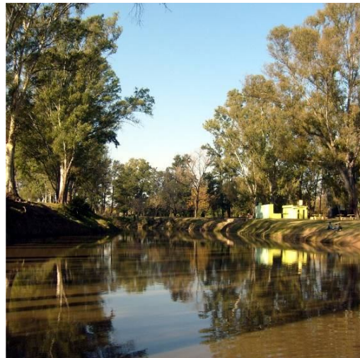
Fotografía 7. Recreo Cascallares