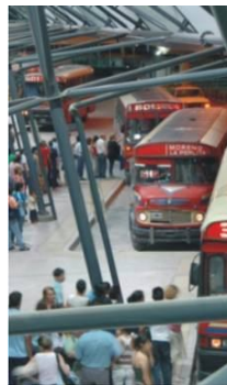
Centro de Tránsito