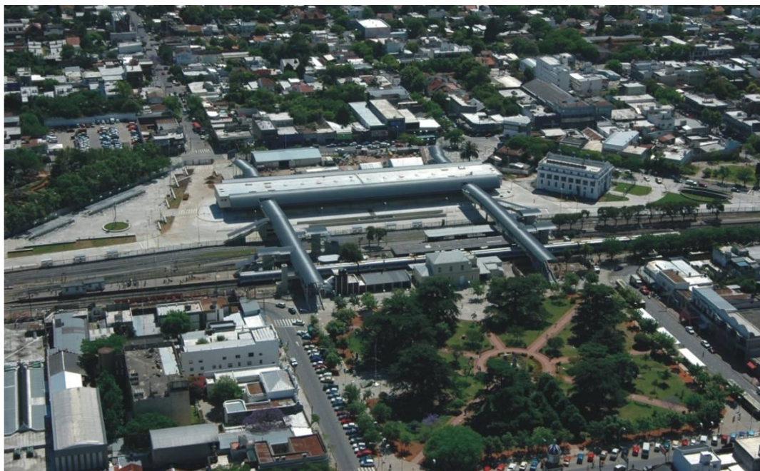
Fotografía 10. Área Central. Casco histórico