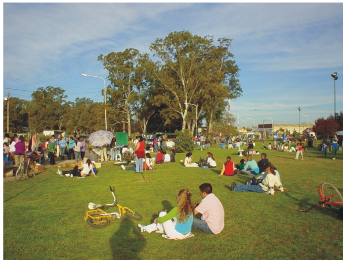
Fotografía 33. Espacio verde público en el predio del Ex Instituto Riglos

A partir de un convenio entre el Municipio y el Consejo del Menor y la Familia en relación al predio del Ex Instituto Mercedes de Lasala y Riglos, se realizaron una serie de operaciones urbanas y edilicias que posibilitaron una mayor conectividad de los barrios aledaños y la localidad de Paso del Rey, con la red primaria. Ello posibilitó disponer cerca de 15 hectáreas de espacio verde público en plazas: Parque de la Familia, Anfiteatro, Paseo de los Artesanos y alrededor de 4 ha para áreas deportivas. (ver fotografía 33)