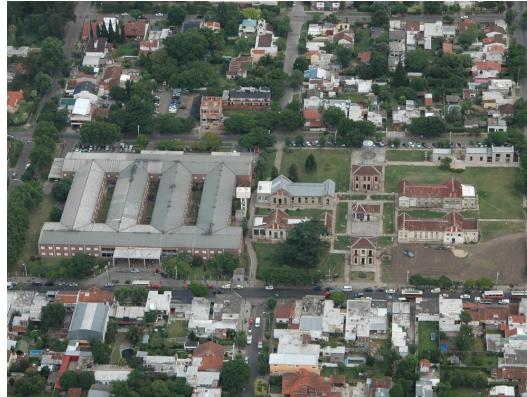
Fotografía 26. Vista aérea del solar del Nuevo Moreno Antigo y el nuevo hospital