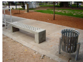
Fotografía 13. Equipamiento Urbano