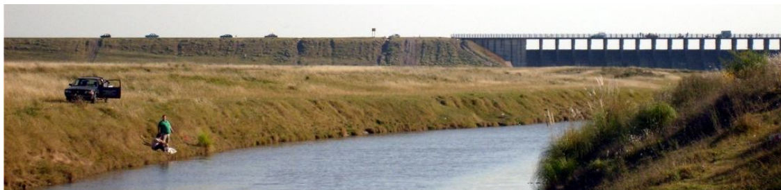
Fotografía 2. Represa Ingeniero Roggero

Una senda peatonal y una bicisenda acompañan el camino en todo su recorrido favoreciendo las actividades aeróbicas y el transporte alternativo. ( ver fotografía 6 )