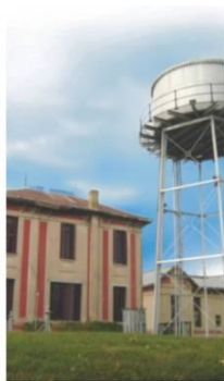
Solar del Nuevo Moreno Antigo