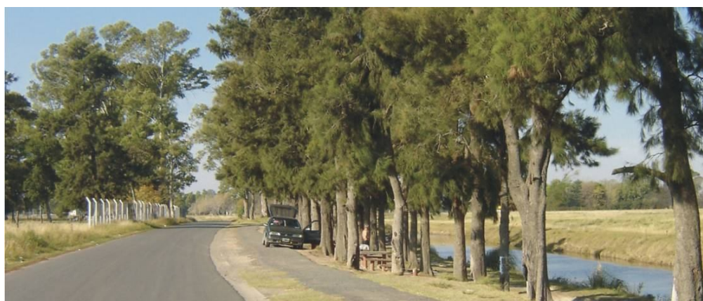
Fotografía 4. Forestación de la ribera