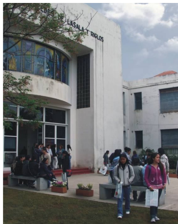
Fotografía 27. Acceso al Centro Universitario

El edificio del ex Instituto Mercedes de Lasala y Riglos, perteneciente al Consejo Nacional del Menor y la Familia, fue transferido al Municipio de Moreno el 27 de agosto de 2003, a través del Convenio Marco de colaboración para el cumplimiento de la Convención sobre los Derechos de Niño. El predio, de enorme importancia estratégica en relación al partido de Moreno y a su desarrollo local, inserto en el continuo urbano entre el centro de Moreno y Paso del Rey, es tal vez, la centralidad más importante luego del propio centro urbano.