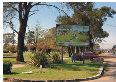
Fotografía 36. Acceso al espacio público

La Feria de Productores Artesanales Dr. Buján ("La Buján") brinda un lugar para que los emprendedores ofrezcan sus productos. Con el tiempo se fueron incorporando actividades culturales y recreativas para atraer visitantes y darles una oportunidad a muchos artistas locales de contar con un espacio para expresarse y darse a conocer.