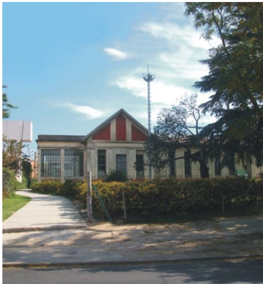
Fotografía 21. Camino de adoquines reconstruido