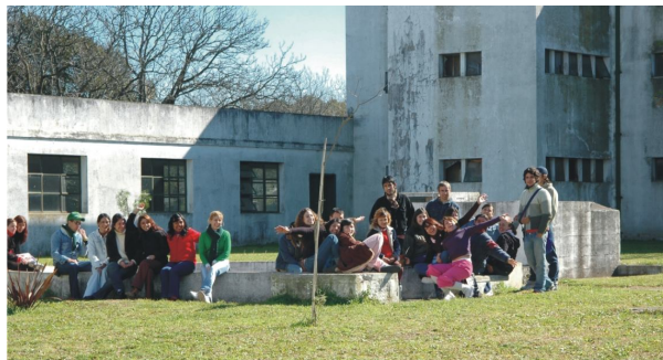
Fotografía 32. Patio interno

Actualmente desarrollan sus actividades distintas universidades, tecnicaturas, cursos de capacitación para el desarrollo local, como así también se ha concretado un convenio con la UOCRA para la creación de un Centro de Formación Profesional (Todos estos sectores dotados de instalaciones especiales para el desarrollo sus actividades específicas).