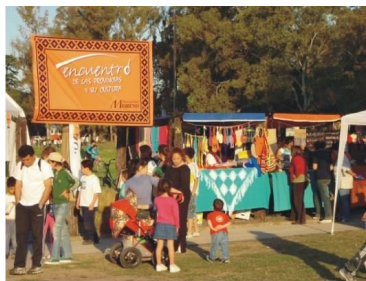
Fotografía 35. Fiesta del Encuentro de las provincias