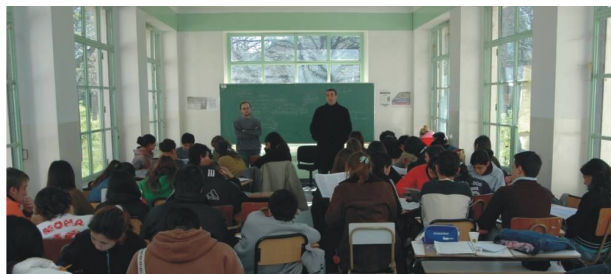
Fotografía 29. Aulas refuncionalizadas

Como consecuencia de la crisis económica surge la necesidad de capacitar al más amplio sector de la población, para aumentar y mejorar aptitudes laborales, instruyéndola en oficios, artes y profesiones que posibiliten su inserción en el mercado laboral con capacitación formal y no formal.