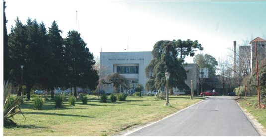
Fotografía 28. Calle interna de acceso

La refuncionalización y puesta en valor, es para ser usado por la comunidad de Moreno con fines sociales, educativos universitarios y terciarios, recreativos y de capacitación para la producción.