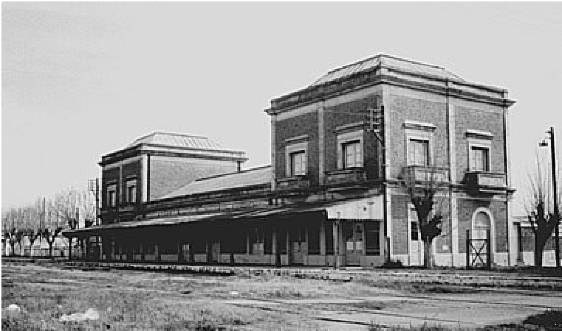
Fotografía 3 de 1977. El 1º de noviembre de 1889 se prolongó la vía desde la primitiva estación Ensenada hasta una nueva, más cerca de la ciudad y del puerto de La Plata.

El crecimiento de Ensenada se apoyó en la llegada del ferrocarril y la radicación de diferentes empresas. En tan sólo un año de vida, tenía más de mil habitantes instalados en los alrededores de la estación ferroviaria.