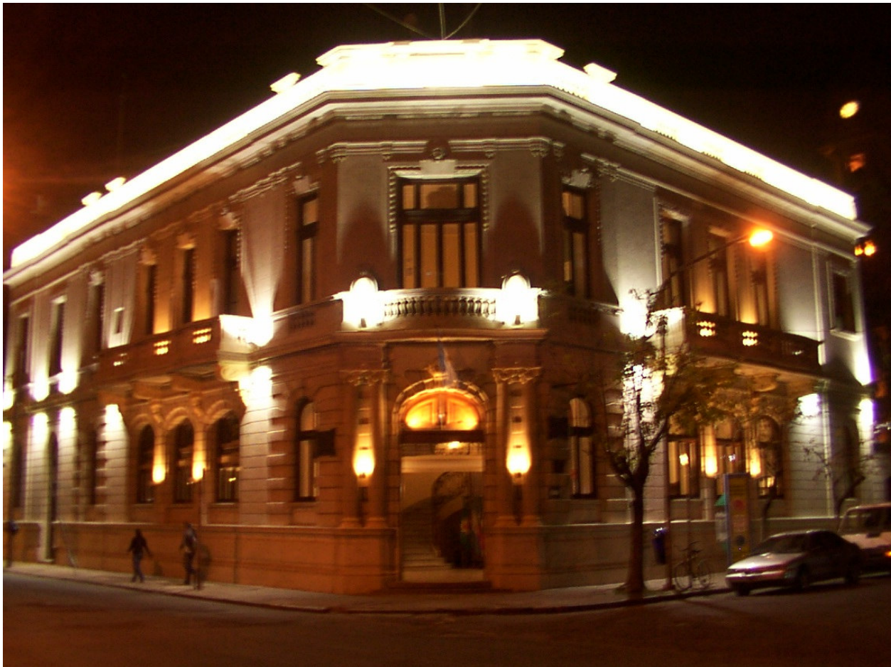
Fotografía 1 Palacio Municipal recuperado

La traza de la plaza Belgrano de Ensenada fue diseñada por Pedro Cerviño en 1801. El histórico edificio Municipal frente a la plaza principal de la localidad, Calles La Merced esquina