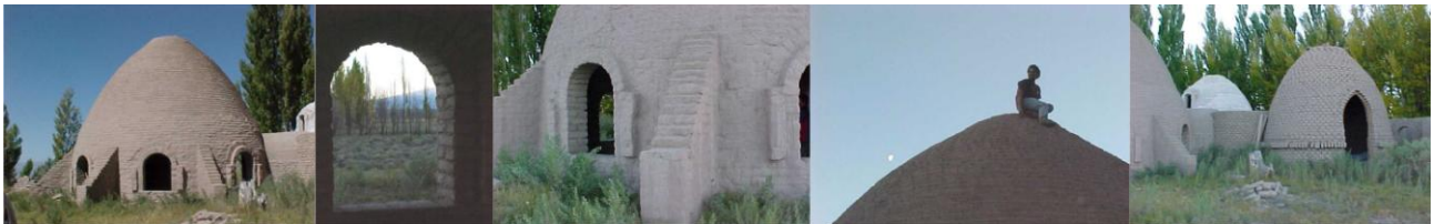
Figura 7 – Guañizuil, Trulys

En este sitio se visitan los trulys, construcciones que responden a los principios de la ecoarquitectura, son de adobe con base circular y techo abovedado, el peso de la cúpula hace que los muros se estabilicen por medio de contrafuertes. La unión entre el encadenado y la cúpula así como entre el muro y el encadenado debe ser muy estable para transmitir las fuerzas horizontales del sismo. Se conocen científicamente porque es un tema estudiado y analizado por el Arq. Gernot Minke. Si bien no son característicos del lugar tienen un estilo y tecnología apreciables para el visitante.