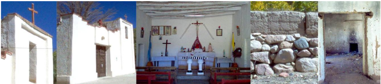
Figura 2 – Colanguil, Capilla de San Isidro Labrador - Antigua Construcción (1750)

Este conjunto edilicio, necesita intervenciones para asimilar a los visitantes sin que sean afectados en su integridad. Por lo que se propone una consolidación estructural a los edificios, ruinas y mejoramiento del entorno.