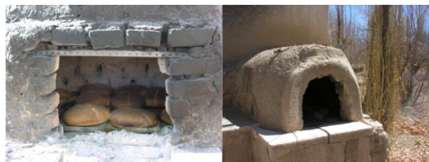
Figura 8 – Hornos de barro

La forma es simplemente una cúpula autoportante, apoyada en una base cuadrada. Es la utilización óptima de las dimensiones, de la geometría, de una utilización racional de los fenómenos físicos naturales como la conversión del aire, la radiación de los materiales, la ubicación de las aberturas.