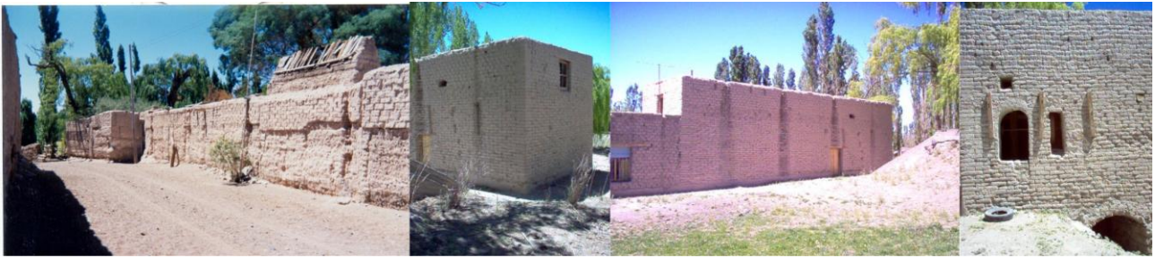
Figura 6 – Villa Iglesia y Bella Vista, Tapias - Molinos