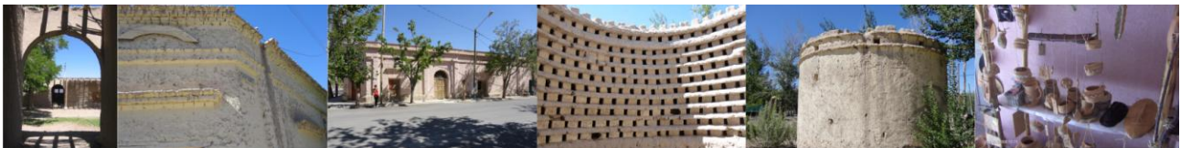
Figura 3 – Las Flores, Casonas Italianizantes - Palomar - Artesanías

Siguiendo por el Llano Alegre, siempre en la localidad de Las Flores, se realiza la siguiente parada en la casona de la artesana ceramista donde ella espera a los turistas trabajando sus cacharros. Allí se puede comprar o apreciar la preparación del barro, construcción y cocción de distintas piezas de cerámica.