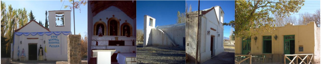
Figura 5 – Rodeo, Capilla Santo Domingo de Guzmán - Casona

Se visita la capilla ubicada en el centro de la localidad, donde se venera a Santo Domingo de Guzmán. Tiene una rica historia en lo que se refiere al edificio, imaginería y devoción. Como la mayoría de las capillas ha sido construida con sistemas constructivos tradicionales y con materiales extraídos directamente de la naturaleza. Posee muros de adobe, los techos tienen pendientes a dos aguas, de madera, con enramada, y palos atados con tientos de cuero, cubierta de torta de barro, revoque grueso de barro.. En el recorrido por la calle principal de nombre Santo Domingo se pueden apreciar casonas antiguas remodeladas algunas para comercio, restaurante y otros.