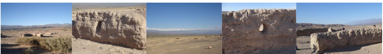
Figura 1 – Angualasto, Ruinas arqueológicas

La instalación humana de Punta de Barro estaba situada al norte del barreal de Angualasto, al pie de la cadena de lomas que separan el piedemonte, bajo el piedemonte medio, ubicada en una loma en la cercanía de una vertiente que por su poco caudal necesitaba ser represada para regar los sembrados, a través de acequias y canales de los que quedan rastros. Esta población estaba situada a 1.800m de altura y se encuentra protegida de los vientos del oeste por las lomas. La ruinas se encuentran sin ninguna protección y expuestas a ser dañadas, para transformarse en museo de sitio y ser un recurso turístico urge ser trabajadas para su conservación. Angualasto es un poblado con disposición aterrazada posee hermosas vistas y sus pobladores alternan trabajos agrícolas con las labores artesanales, elaboración de vino patero, cerámica, trenzado de cuero y tejido al telar.