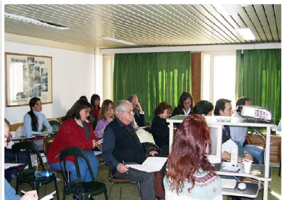
Etapa 1. Foto del seminario taller

CIRVINI, Silvia Augusta y otros. Patrimonio Arquitectónico del Área Metropolitana de Mendoza . – 1ª ed., Buenos Aires: Consejo Nacional Investigaciones Científicas Técnicas – CONICET, 2009. CD-ROM. ISBN 978-950-692-082-1-1. Arquitectura. I. Título – CDD 720.