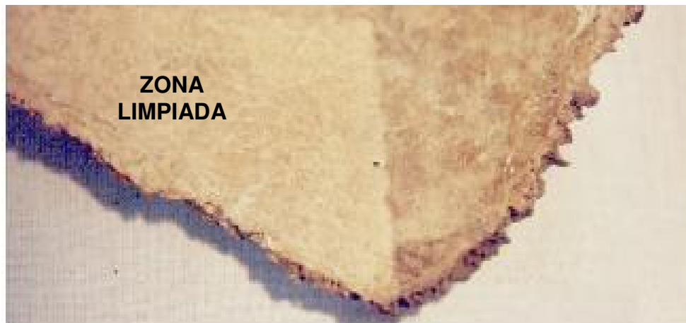
Figura 4: Limpieza con láser de un cráneo precolombino

Limpieza realizada con láser: Además de la ventaja de realizar una limpieza seca, se pueden tratar sin inconvenientes zonas debilitadas con rugosidades o relieves. Ritmo de limpieza: 8 cm 2 /min. a 10 Hz