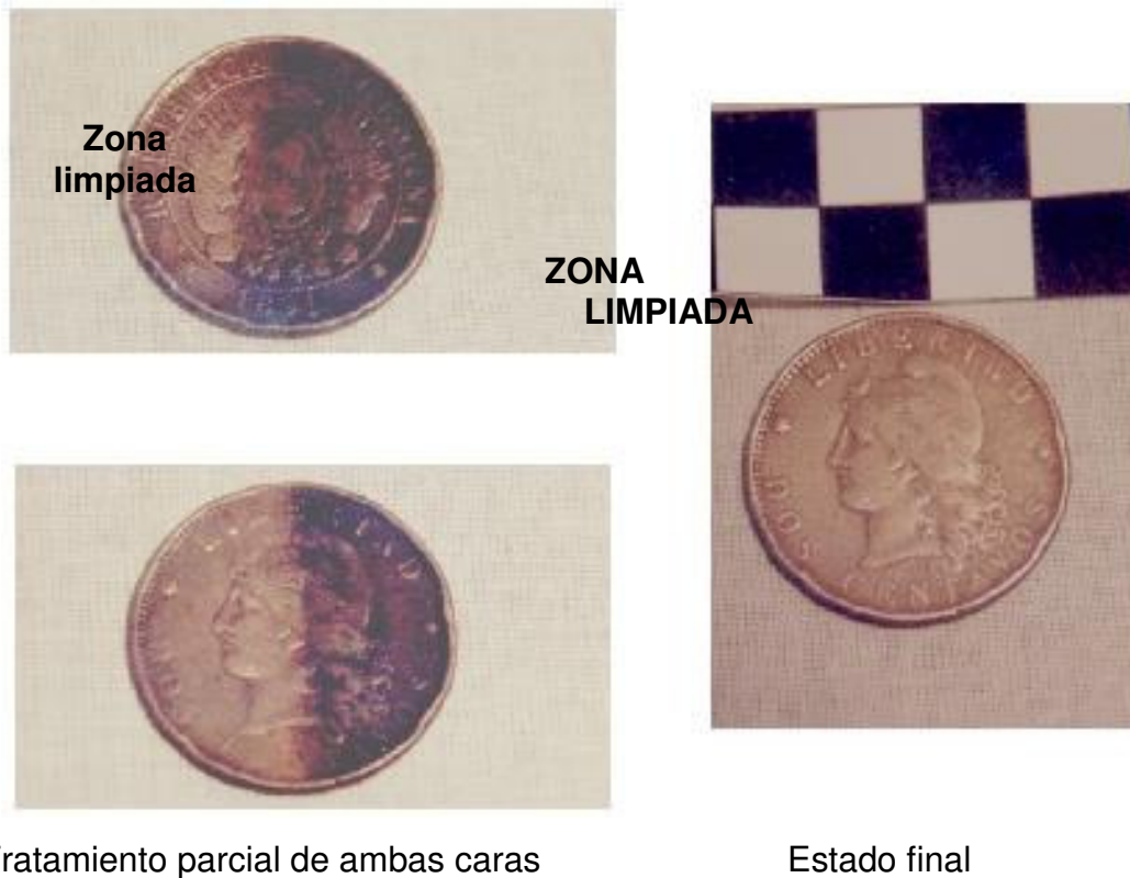
Figura 2: Limpieza con láser de una moneda de cobre