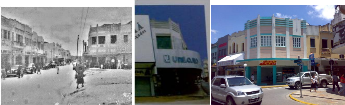
Imagem 03 e 04 e Foto 08: Rua Maciel Pinheiro, década de 40 com o edifício n.287 a direita da foto, o mesmo durante a intervenção de restauro (quando ainda era o original) e no ano de 2011, sendo o falso histórico.