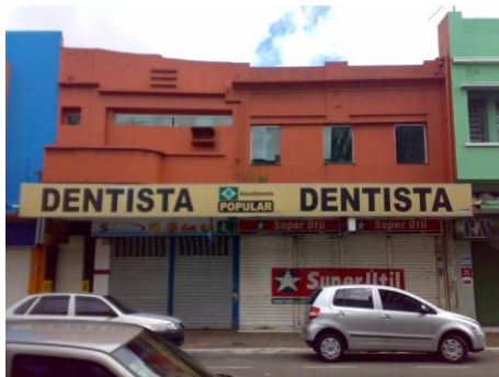
Foto 05: Edifícios n.165 (esq.) e n.173 atualmente.

A maioria destes casos já havia ocorrido antes da restauração do Projeto Campina Decó, mas só foram explicitados após a retirada das placas, faixas e letreiros que encobriam suas fachadas. O que limitou as ações a serem empreendidas nestes bem, pois devido à grande quantidade de elementos perdidos e as alterações ocorridas, sua retomada significaria muitas reconstruções e resultaria em um possível falso histórico. A autenticidade esta completamente comprometida nestes casos. Contudo, sua relação com o entorno, devido à forma como foram pintados, na mesma cor, minimizaram visibilidade das alterações. Além disso, devido aos poucos elementos de herança histórica que ainda se conservam, e por seguirem a mesma escala de altura da maioria dos edifícios do conjunto arquitetônico e urbano, estes integram aos demais edifícios sem comprometer sua autenticidade.