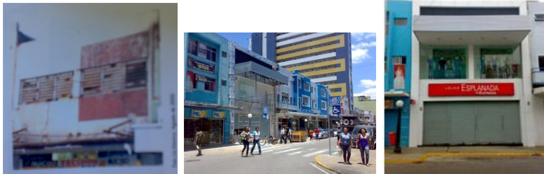
Imagem 02, Foto 06 e 07: (Respectivamente): Edifício n.226 no ano de 2000 (durante o levantamento da área para o restauro), mesmo edifício sendo reformado em outubro de 2010 e seu estado no ano de 2011.

exemplares históricos perdidos, considera-se a predominância de edificações contemporâneas harmoniosas com o conjunto como fator positivo a sua autenticidade.