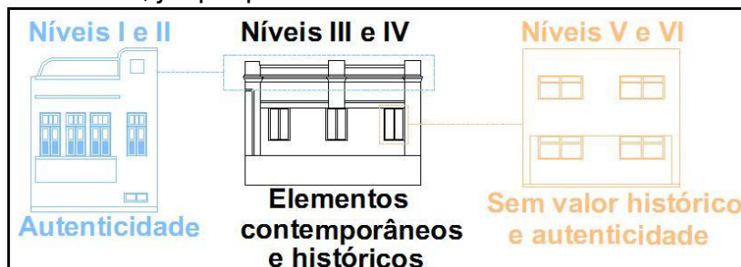
Imagem 05: Gráfico explicativo da relação entre os níveis e a autenticidade.

A divisão dos edifícios locados na Rua Maciel Pinheiro em seis diferentes níveis levou em consideração, além do comum estado de conservação dos exemplares agrupados, o índice em que estes contribuem ou prejudicam na autenticidade do conjunto, ou seja, os seis níveis são uma escala onde os dois primeiros níveis contribuem a autenticidade do conjunto arquitetônico e urbanístico da Rua Maciel Pinheiro, os dois últimos prejudicam e os dois níveis intermediários ligam-se ao maior índice, já que possuem tanto elementos harmoniosos como não.