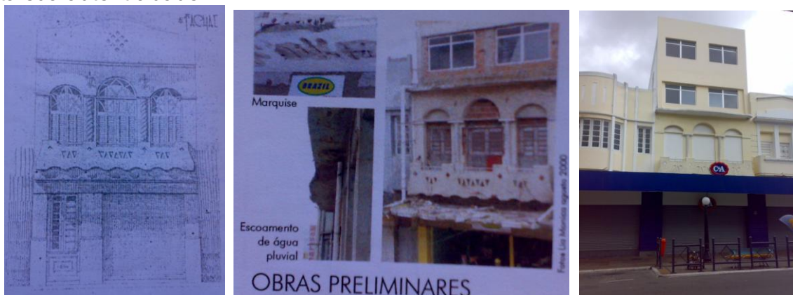
Desenho 02, Imagem 01 e Foto 04: (Respectivamente) Projeto original da fachada do edifício (Década 1930), estado do edifício n.213 antes do projeto de restauro e estado atual (2011)

Apenas um edifício do conjunto arquitetônico e urbano da Rua Maciel Pinheiro foi diagnosticado como portador de elementos contemporâneos que não interagem de forma harmoniosa com sua parte histórica. O edifício n. 213, que possui um volume que compromete o seu entendimento e, mesmo diferindo-se da construção original, afeta sua autenticidade.