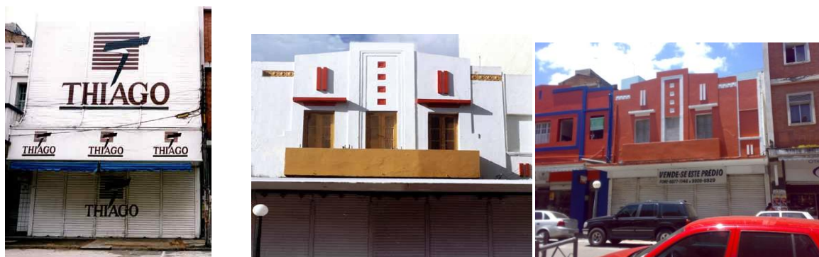
Fotos 01, 02 e 03: Respectivamente, edifício n.112 antes da intervenção do Projeto Campina Decó, depois do restauro e nos dias atuais (2011).

Os edifícios listados nessa categoria por conservarem a fisionomia original de sua fachada superior e terem sofrido poucas ou nenhuma intervenção de restauro, são considerados como autênticos. Dos 65 edifícios locados na Rua Maciel Pinheiro 21 são assim caracterizados. Destes um, a Biblioteca Municipal, é tombada pelo IPHAEP, e a Associação Comercial cadastrada pelo mesmo órgão. Os outros 17 edifícios considerados autênticos, a maioria, mesmo antes da intervenção de restauro do projeto Campina Decó observa-se que ainda ostentavam todas as suas características art decó, estando apenas mal conservados e ocultados por placas, letreiros ou falsas fachadas. Assim, nestes casos houve apenas reparo das superfícies e ornatos danificados, além de uma eventual pintura.