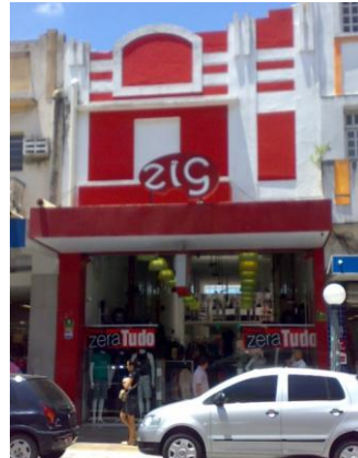
Desenho 01 e Foto 03: Projeto de fachada oriundo da década de 1930, e edifício n.186 no seu atual estado de conservação.