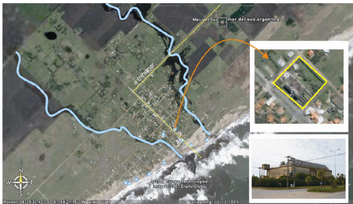
Ubicación geográfica de la localidad de Mar del Sur.

Di PIETRO PAOLO, Luis. (2001) Cultura y Desarrollo local, en Santillán Güemes, Ricardo y Olmos, Héctor: Capacitar en Cultura. Buenos Aires. GONZÁLEZ VARAS, Ignacio (1999) Conservación de bienes culturales, Teoría, historia, principios y normas, Manuales Arte Cátedra, Madrid, España. MUSTAFA, Ali (compilador) (2007) Cooperación Cultural Internacional: problemas temas y desafíos. Argentina. MATHIESON, Alister y Geoffrey WALL (1990) Turismo. Repercusiones económicas, físicas y sociales. Ed. Trillas. Turismo. México. RAMÍREZ, Alejandra (2005) “Las potencialidades y el conocimiento de la realidad local: estudio de caso de la gente, las políticas socioculturales, las organizaciones y la infraestructura sociocultural de la ciudad de Cochabamba” en Sueños y cambios. Cultura, gestión organizacional y desarrollo local en la ciudad de Cochabamba. Capítulo N° 6. Bolivia.