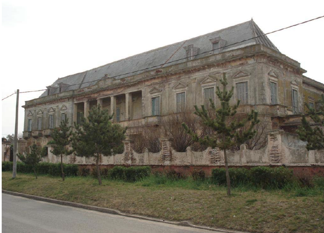
Fotografía actual del Hotel Boulevard Atlántico