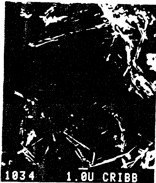
2a. Fotomicrografía de SEM. Cristales asciculares de ettringita (E) y agregados intergranulares de calcita (C).

E: ettringita; C: calcita; F: feldespato; Q: cuarzo; S: silicato de calcio