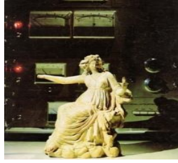
Figura 2 .Ciência e arte