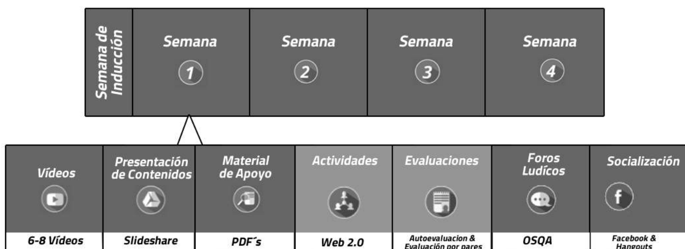
Figura 2. Modelo de desarrollo MOOC's para el Proyecto Telescopio