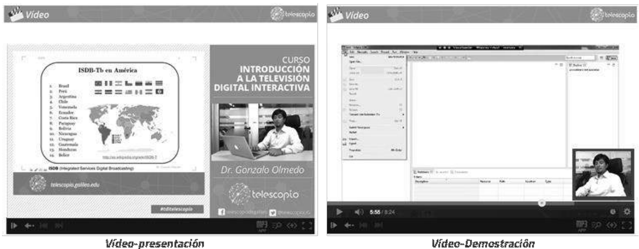
Figura 3. Tipos de Vídeos