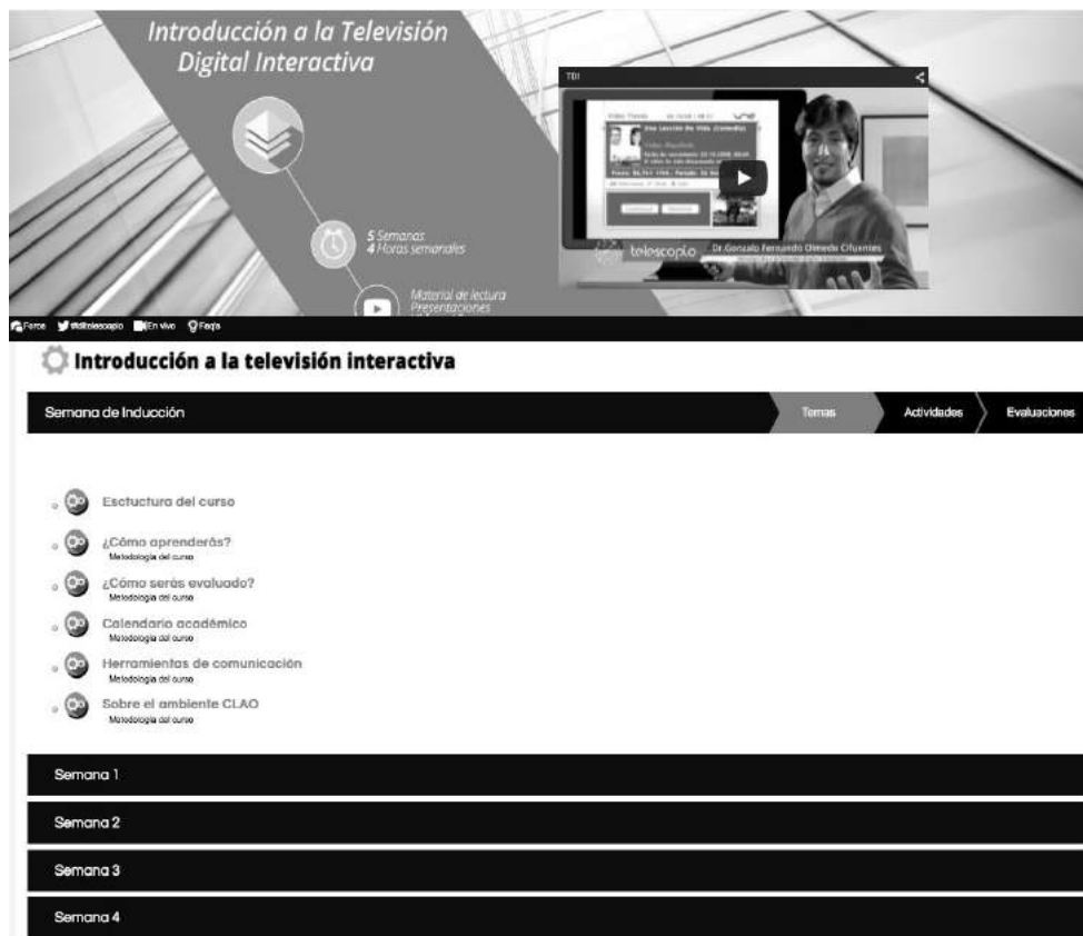
Figura 2. Homepage del MOOC “Introducción a la Televisión Digital Interactiva”

figura 3. El material multimedia se complementa con un conjunto de lecturas, material de apoyo y referencias de utilidad.