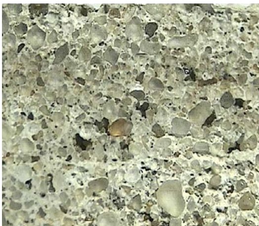
Fotografía 1: Se observan en el mortero los clastos de cuarzo del agregado fino rodeados por el material ligante.

Observaciones realizadas sobre un mortero, correspondiente a un edificio de valor patrimonial del siglo XX, década del 50, se detecta que está constituido por una matriz en la cual se han incorporado fragmentos de ladrillos de diferentes tamaños (Ver Fotografía 2). Los fragmentos de ladrillos son incorporados a los morteros, prácticamente desde el imperio Romano, ya que por su naturaleza porosa hacen que los mismos sean más permeables al aire y permitan una adecuada carbonatación de la cal. En otros casos los ladrillos son finamente triturados incorporando este polvo al mortero debido a su reactividad puzolánica, que depende de las características de la arcilla y de la temperatura de cocción del ladrillo [10].