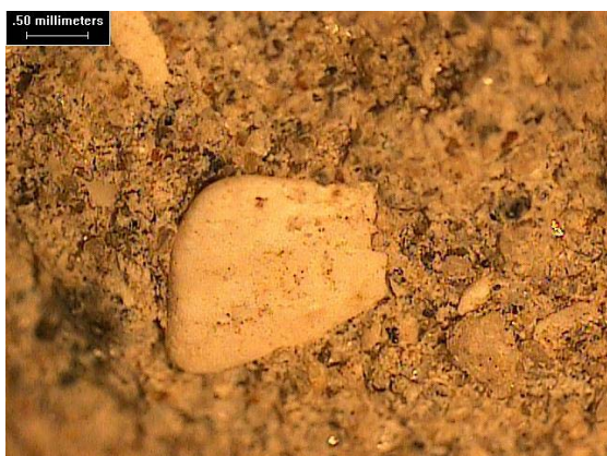
Fotomicrografía 1 Imagen del corte de un mortero. Se observa un fragmento de valva con adherencia mecánica a la matriz.

En localidades ubicadas sobre el litoral bonaerense se observan morteros de asiento con porcentajes variables de conchillas, que por su forma se ubican en forma paralela a la superficie de contacto con el mampuesto. La naturaleza de la adherencia que se alcanza entre la matriz y los agregados se debe al entrecruzamiento mecánico que ocurre entre las irregularidades de los agregados y a la adhesión causada por fuerza van del Waals, entre los agregados y los productos de hidratación de la cal. A esta situación debe sumarse algunas reacciones químicas en la interface que podría contribuir al desarrollo de la resistencia. Experiencias desarrolladas muestran que en la superficie de fractura de ensayos de adherencia pasta-mármol (carbonato de calcio) se incrementa el desprendimiento de roca con la edad, lo cual estaría indicando en el caso de matrices cementíceas una reacción química con el sustrato de composición similar [11]. Esta situación podría estar indicando que en las conchillas, en el último caso una estructura mayoritariamente de carbonato de calcio, tendrás una adherencia de tipo mecánico que depende de la rugosidad de la valva y otra de tipo físico químico, sin embargo por razones de trabajabilidad no resulta conveniente la incorporación de porcentajes elevados de conchilla. En hormigones de cemento Pórtland este valor se encuentra limitado a un 30% en el caso de las arenas [12] (ver Fotomicrografía 1 y 2)