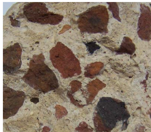
Fotografía 2: Se visualiza en el mortero la matriz conformada por agregado fino, material ligante y fragmentos de ladrillos.