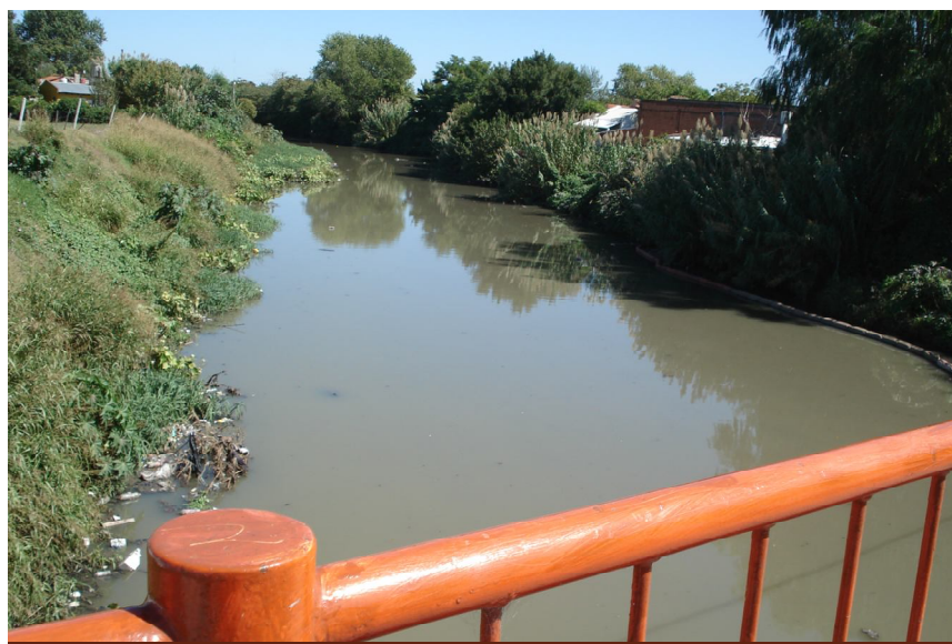
Figura N° 3 Arroyo Del Gato (7 y 514)

Tanto las medidas de niveles como la toma de muestras de agua fueron realizadas en perforaciones particulares, bombas sapos, molinos, etc. El relevamiento de campo se realizó entre abril y marzo de 2011