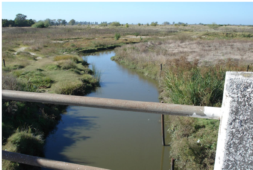
Figura N° 2 Arroyo El Pescado (Ruta N° 11 y arroyo)

En la cuenca del Arroyo del Gato se hizo un muestreo de las aguas superficiales en cuatro puntos del arroyo, uno próximo al Hospital de Melchor Romero, en el sector de nacientes del arroyo, otro en el sector medio, el tercero en el último tramo antes de su canalización (7 y 514) y un cuarto en el sector de propulsora. Las aguas subterráneas se muestrearon en nueve freáticos instalados en la cuenca y corresponden al acuífero pampeano (Ver Tabla N° 2).