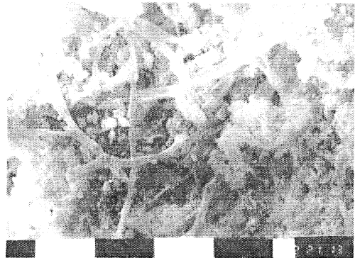
Fig. 2. Imagen obtenida en MEB (Microscopio electrónico de barrido) del Liqueo Bacidia sp. Se notan las hifas (filamentos) penetrando el cemento.

No siempre es necesario o posible eliminar los organismos colonizantes. Al tomar esta decisión, se debe tener cuidado en la elección de los métodos de limpieza a emplear, ya que también hay casos en que al eliminar las colonias de algas o líquenes se deja al material debilitado con una superficie fuertemente erosionada expuesto a otros agentes de ataque, lo que a la larga puede resultar contraproducente. Pruebas realizadas en el LEMIT dieron como resultado que las muestras de cemento no colonizado por líquenes toleran bien el hidrolavado, mientras que las muestras colonizadas tuvieron pérdida e agregado fino, dejando la superficie con aspecto erosionado. Se observó además que algunos monumentos y edificios observados en la Provincia, al cabo del año del hidrolavado convencional, otra vez se hallan colonizados por líquenes (6). En cambio, las muestras de materiales diversos expuestas a la intemperie en el LEMIT durante dos años y medio no presentan crecimientos biológicos notables. La única excepción son las colonias incipientes de líquenes y cianobacterias en las tejas, lo cual se explica porque este material es mucho más poroso que el resto.