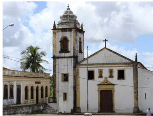
Figura 1: Igreja dos Santos Cosme e Damião, datada do século XVI, em Igarassu