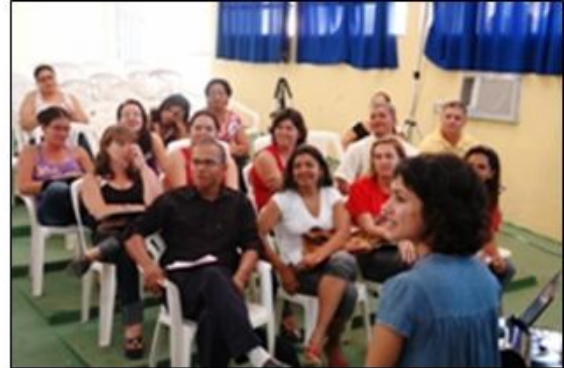
Figuras 7 e 8: Oficina Educação Patrimonial dentro e fora da sala de aula