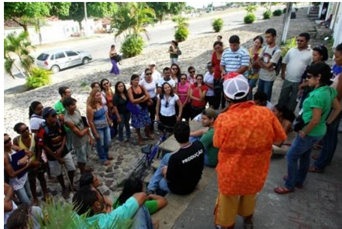
Figura 6: Seminário no Encontro de Educação Patrimonial em Goiana

Durante os Encontros foram realizadas quatro oficinas de educação patrimonial com enfoques diferenciados, visando mostrar para a comunidade as diversas formas em que ela poderia atuar para colaborar com a preservação de seu patrimônio cultural. Nesse sentido, delinear-se as seguintes atividades: