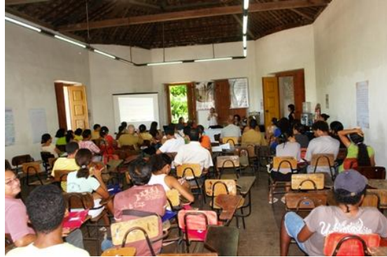
Figura 5: Seminário no Encontro de Educação Patrimonial em Goiana