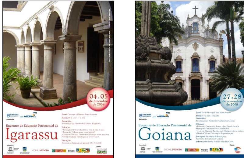
Figura 9 e 10: Cartazes dos Encontros de Educação Patrimonial de Igarassu e de Goiana.

- Produto final do Projeto de Educação Patrimonial: publicações para os municípios de Goiana e Igarassu.