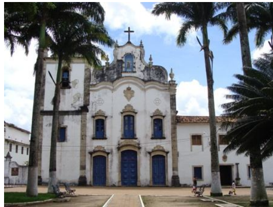
Figura 2: Igreja de N. S. do Carmo e Convento de Santo Alberto dos Carmelitas.

Além disso, também está salvaguardado, o Conjunto Arquitetônico e Paisagístico de Igarassu que reúne, além dos monumentos citados, a Colina Histórica, diversas edificações centenárias, ruas e praças de traçado característico do período colonial, as ruínas da Igreja de Nossa Senhora da Misericórdia, o Sobrado do Imperador, trecho de mata atlântica e do rio São Domingos e grande área de manguezal 6 .