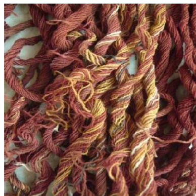
Figura 4: Detalle de los flecos

Limpieza mecánica, limpieza puntual de hongos y manchas del anverso, reverso y en el interior de la chuspa. Limpieza puntual con solvente, después limpieza con triple A que se aplicó a todo el textil, realización de meza con papeles tisú, humectación de textil para plancharlo, se colocó enzima el papel tisú y después se puso peso, para el planchado.