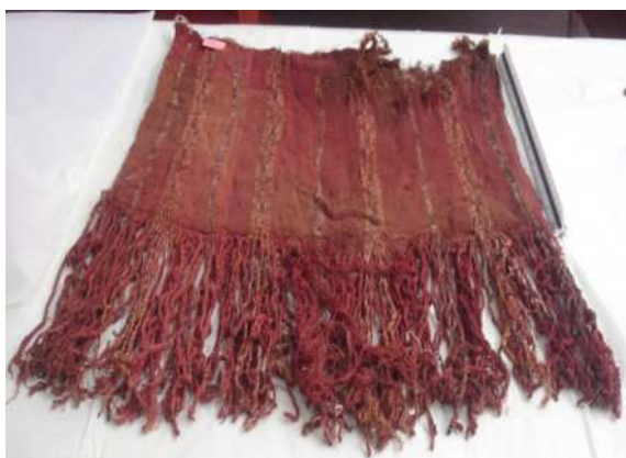
Figura 1: Anverso

Se realizó la ficha de ingreso, toma de muestras, fotos del estado de conservación anverso y reverso.