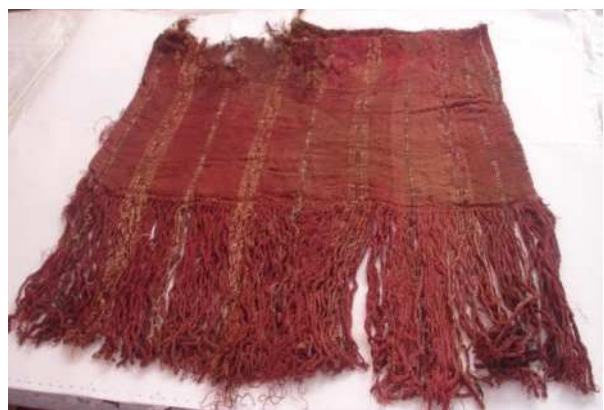
Figura 2: Reverso