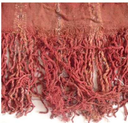
Figura 3: Detalle de los flecos