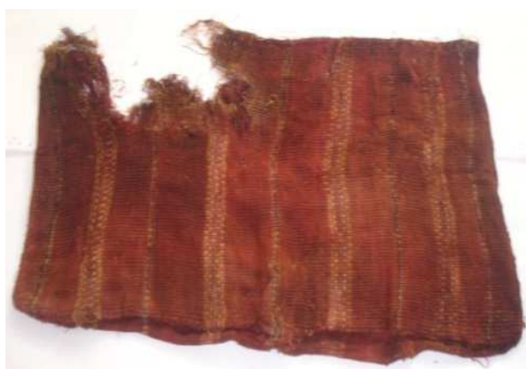
Figura 5: Limpieza completa

Limpieza mecánica, limpieza puntual de hongos y manchas del anverso, reverso y en el interior de la chuspa. Limpieza puntual con solvente, después limpieza con triple A que se aplicó a todo el textil, realización de meza con papeles tisú, humectación de textil para plancharlo, se colocó enzima el papel tisú y después se puso peso, para el planchado.