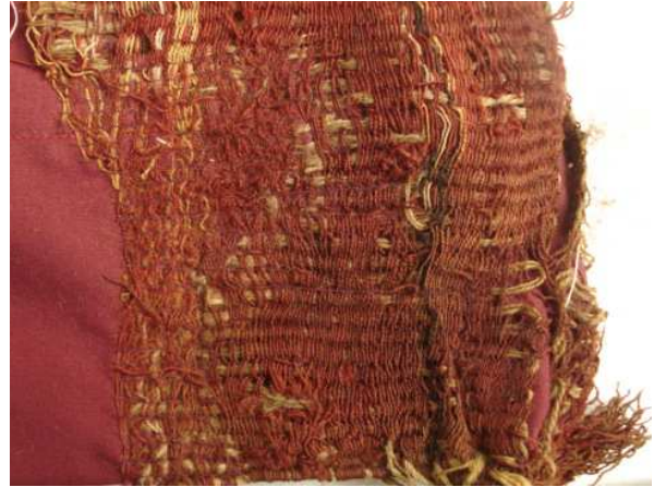
Figura 9: Punto de restauración