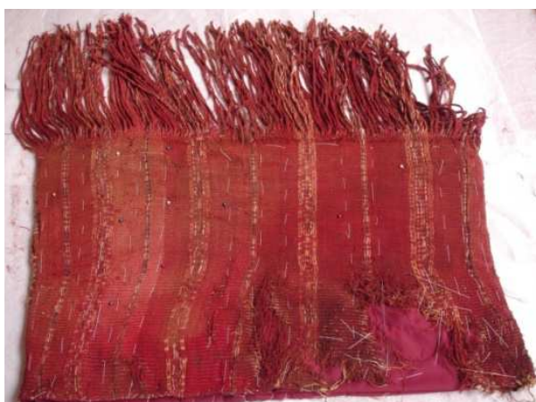
Figura 7: Hilván del textil

Después se introdujo la tela de refuerzo en medio de la chuspa se procedió a fijarla con alfileres, una vez fijado el textil se hilvano teniendo mucho cuidado de no desgarrar el textil ni deformarlo. Fijado del textil mediante el punto invisible, se peinaron y ordenaron las fibras que están sueltas, para que sigan el mismo orden que tenían. Se realizó la consolidación con el punto de restauración.