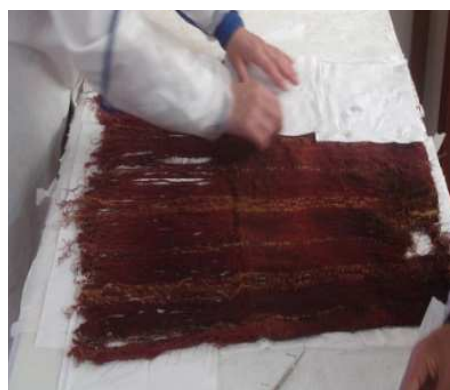
Figura 6: Colocación de papel tisú

Retiro de las placas de vidrio y papel, se realizó la torsión de los flecos que estaban en mal estado se les fija, los flecos que ya estaban ordenados y fijados se les ponían papel tisú y peso para plancharlos.