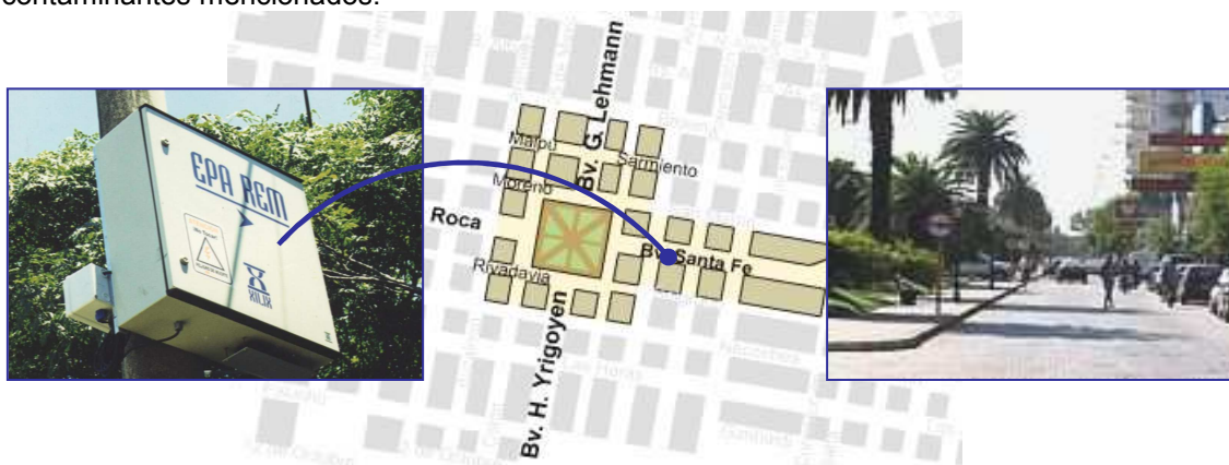
Figura 1: Ubicación de la estación remota de control de calidad de aire.

Los niveles de contaminación fueron registrados por un sistema de monitoreo continuo que incluye la estación remota mencionada, ubicada en Rafaela y una estación central receptora de los datos, instalada en la Facultad Regional San Nicolás. Los datos son recibidos a través de un sistema de telefonía celular y según el programa de monitoreo establecido, representan promedios horarios de los contaminantes mencionados.