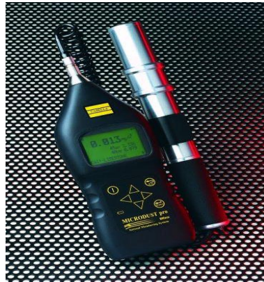
شکل ۱: Casella's. Microdust pro Particulate Monitor

اندازه گیری در زمان بروز طوفان ریز گرد ها و در دو نوبت صبح و عصر طبق استراتژی بیان شده توسط سازمان EPA و مطالعات مشابه (۱۴) صورت گرفت. جهت اندازه گیری کل ذرات معلق از دستگاه Casella USA, Microdust pro Particulate Monitor