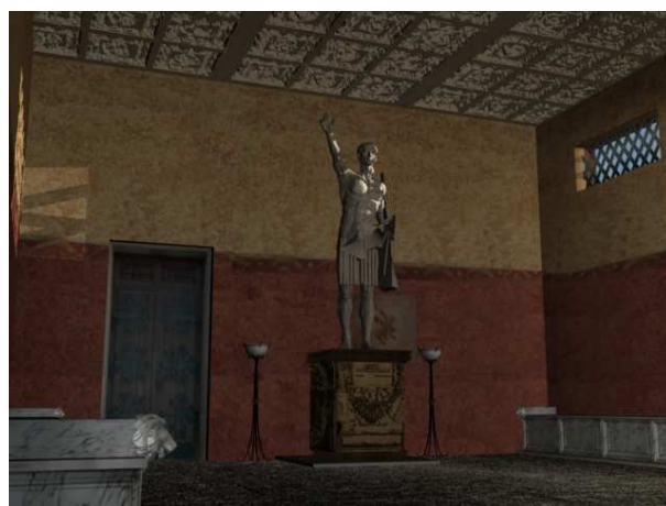
Figura 8. Vista desde el acceso de la curia. En primer plano los bancos adosados.