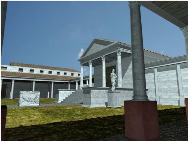
Figura 6. Vista desde el pórtico simple de la Aedes . Al fondo la basílica y el porticus simplex

El siguiente espacio lo conformaba la aedes . Ubicada en el lado oeste, se enmarcaba presidiendo en eje axial todo el conjunto público monumental. Dicha aedes se configura como tetrástila sine posticum , con unas dimensiones vitrubianas de 1:2, es decir el largo es el doble de ancho. Se elevaba sobre un pódium con una altura aproximada de 1,80 metros. Durante su excavación se constató su planta íntegra, así como su técnica edilicia y parte del caementum que servía de alma a las escalinatas de acceso, que dejaba entrever un total de unos 7 u ocho escalones (Fig. 9).