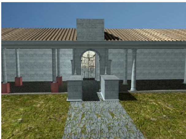
Figura 4. Vista del Arco cuatrifonte desde el interior de la plaza, enmarcando el acceso.