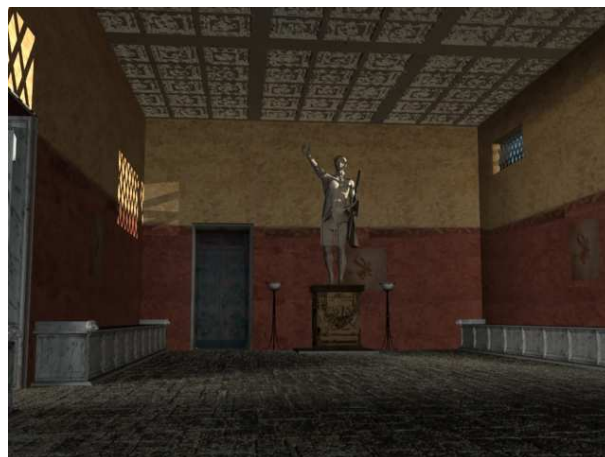
Figura 7. Interior de la curia. Presidiendo la efigie del emperador

A continuación de esta sala, y cada una con el mismo espacio, se hallan las sacella o capillas de culto imperial. Por último y ya en la esquina noroeste, se encuentran la curia y el aerarium . Estas estancias se ubican en la zona más reservada del foro, bajo la protección de la Aedes , a la cual se adosa. La curia era la sede del ordo decurionum y desde ella se dirigía la política de la ciudad. En el interior de esta estancia, la curia, se hallan dispuestos una serie de bancos laterales adosados, lugar en el que se sentaba el ordo . Presidiendo la sala y en eje axial se disponía la efigie del emperador, máxima autoridad legal (Mar y Ruíz, 1987: 41). Así parece corroborarlo la cimentación del pedestal ubicada en la sala. Dicha sala estaba decorada con estucos del tipo rojo pompeyano, con motivos lineales en amarillo. Igualmente estarían, algunas zonas revestidas de mármol, tal y como se documentó durante el proceso de su excavación. El suelo de la estancia estaba pavimentado con ladrillos, los cuales aún hoy se conservan (Fig. 7 y 8).