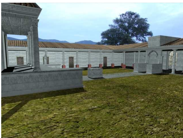
Figura 6. Al fondo porticado simple elevado sobre pilares

A continuación de esta sala, y cada una con el mismo espacio, se hallan las sacella o capillas de culto imperial. Por último y ya en la esquina noroeste, se encuentran la curia y el aerarium . Estas estancias se ubican en la zona más reservada del foro, bajo la protección de la Aedes , a la cual se adosa. La curia era la sede del ordo decurionum y desde ella se dirigía la política de la ciudad. En el interior de esta estancia, la curia, se hallan dispuestos una serie de bancos laterales adosados, lugar en el que se sentaba el ordo . Presidiendo la sala y en eje axial se disponía la efigie del emperador, máxima autoridad legal (Mar y Ruíz, 1987: 41). Así parece corroborarlo la cimentación del pedestal ubicada en la sala. Dicha sala estaba decorada con estucos del tipo rojo pompeyano, con motivos lineales en amarillo. Igualmente estarían, algunas zonas revestidas de mármol, tal y como se documentó durante el proceso de su excavación. El suelo de la estancia estaba pavimentado con ladrillos, los cuales aún hoy se conservan (Fig. 7 y 8).