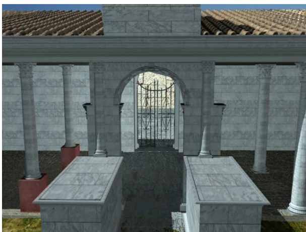
Figura 5. Vista del Arco cuatrifonte. Detalle