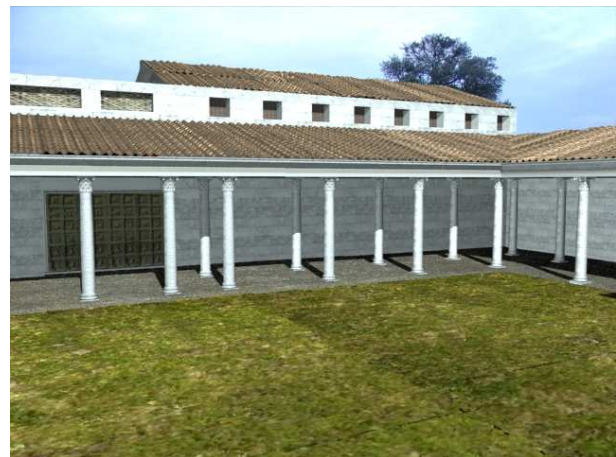
Figura 3. Vista de la basílica y Tribunal/Aedes. Se elevan por encima del porticus dúplex para poder conseguir iluminación.

Resulta llamativo como los muros que conforman esta estancia son mucho más anchos que los que conforman el resto del foro, arrancando su cimentación enteramente en sillares. Ello denota que los muros de esta estancia soportaron un gran peso, probablemente esta estancia levantaría sus muros por encima del muro que conforma el pórtico doble, para así conseguir iluminación en la estancia. Además probablemente sus muros estarían horadados en altura para colocar los armarios donde se guardarían los volumina de los diferentes procesos judiciales y administrativos, siendo esto una característica propia del tabularium (Ruiz, 1998; 35-36). Con lo que cumpliría también con las funciones de archivo. La cota de suelo de esta sala estaba elevada por encima de la del porticado doble y se salvaba a través de unos escalones. Posteriormente, a este porticado y pequeña Aedes , con funciones de tribunal y tabularium , se le adosaría una basílica, extremo este último no constatado por completo debido a que su espacio está ocupado por la actual ermita de San Pedro de la Zarza o San Mamés, aunque su disposición y planta así parecen atestiguarlo. Este recinto basilical se levantaría por encima de la techumbre del porticado doble para ganar altura y permitir así iluminar la basílica (Fig. 3).