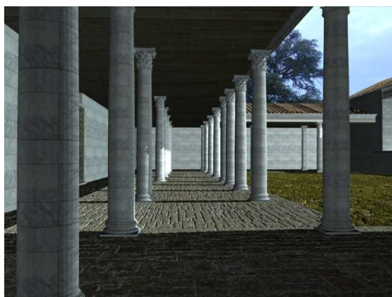
Figura 2. Vista del Porticus duplex

Son numerosos los espacios que se encuentran en este foro. Desde el sur, y comenzando con la primera de estas estancias, destaca un porticus dúplex . Este espacio conforma el lado norte del recinto. Este porticado está sustentando por un total de 28 columnas y por su disposición parece corresponderse con un espacio basilical (Fig. 2).