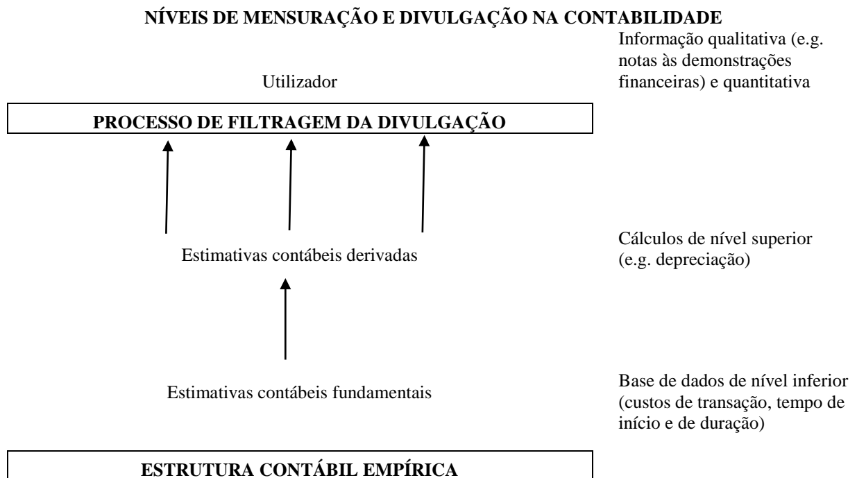
Figura 3. Níveis de mensuração e de divulgação na Contabilidade.

Baydoun e Willett (1995) identificaram níveis nos quais a informação contábil será mais propensa à irrelevância cultural. No nível mais baixo, encontram-se as mensurações fundamentais da Contabilidade (e.g. custo dos inventários, ativos fixos), sendo pouco afetadas por diferenças culturais ou sociais. No nível superior, encontram-se as designadas mensurações derivadas, tais como o cálculo de depreciações, revelando-se como decisões estatísticas específicas e, como tal, com maior probabilidade de se tornarem irrelevantes se transferidas arbitrariamente para outros países. Na última fase, encontra-se o processo de filtragem promovido pela divulgação, que é por definição determinado culturalmente, como observável na Figura 3: