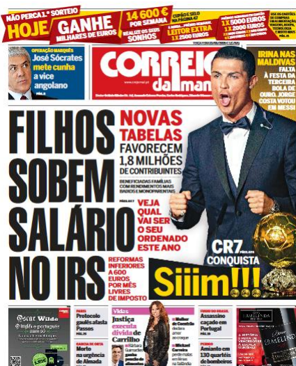
Figura 4 - CM, 24 nov. 2014