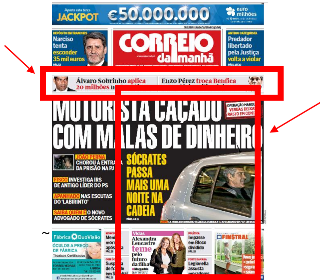
Figura 1 - CM, 24 nov. 2014

Após esta primeira análise, podemos concluir que o desporto, ou mais precisamente, o futebol tem grande peso no CM, por ser a única modalidade a merecer destaque na primeira página do jornal. Porém, salvo raras exceções, como foi, por exemplo, o caso do dia 13 de janeiro de 2015 (um dia após Cristiano Ronaldo ter ganho a terceira Bola de Ouro da sua carreira), o futebol não faz grandes manchetes, ou seja, não ocupa capas inteiras, preenchendo espaços mais pequenos de acordo com a disposição da capa.