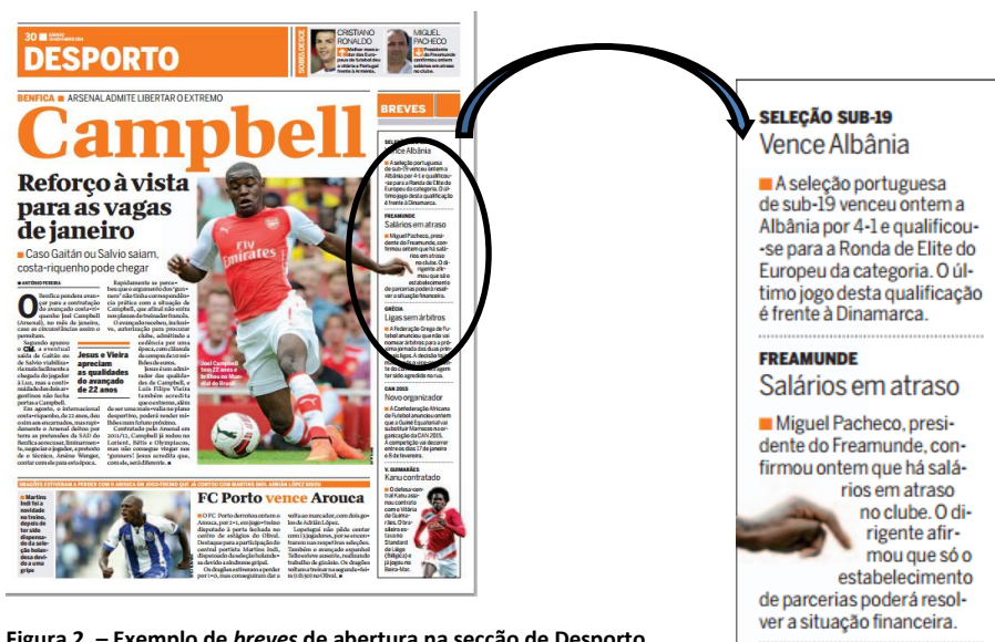
Figura 2. – Exemplo de breves de abertura na secção de Desporto do CM

Para além das breves de abertura há ainda as breves de fecho, situadas à direita, na última página do Desporto que se denomina A Fechar . As breves do fecho dão, normalmente, destaque a modalidades que não têm espaço nem na página de abertura nem em outras páginas da secção, uma vez que estas são na sua maioria dedicadas ao futebol.