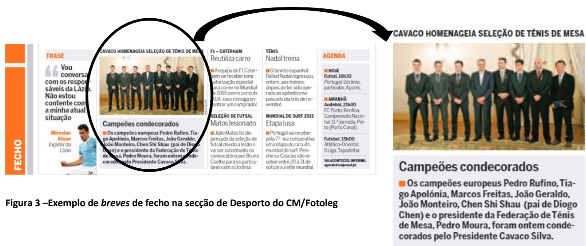
Figura 3 –Exemplo de breves de fecho na secção de Desporto do CM/Fotoleg

As fotolegendas são imagens acompanhadas por uma legenda (normalmente duas a três frases curtas). Podem vir acompanhadas por um cabeçalho, que varia de cor consoante a secção.