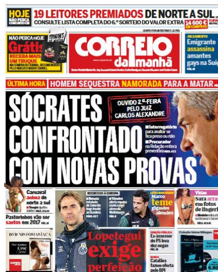
Figura 5 - CM, 19 fev. 2015

Por exemplo, nos dias 24 nov. 2014, 5 dez. 2015 e 19 fev. 2015, o valor notícia associado ao futebol foi substituído pela atenção dedicada ao caso “Operação Marquês”, confirmando a tipologia da escala de preferência dos valores-notícia da imprensa popular, que ora oscila com o destaque dado ao desporto-rei, ora com a saliência de escândalos, crimes, entre outros temas relacionados com o mundo da política ou o carácter reverso da natureza humana.