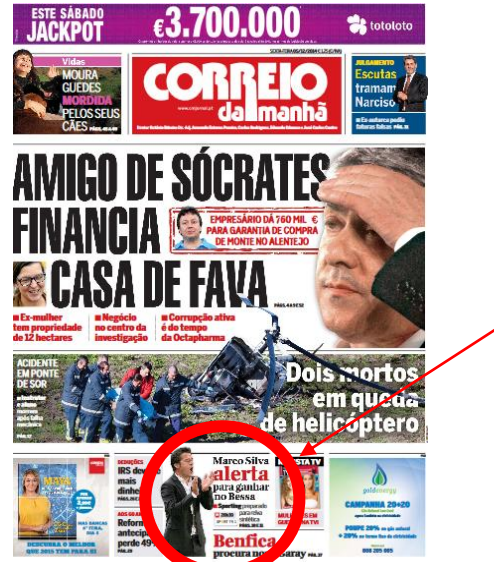
Figura 2 - CM, 5 dez. 2014