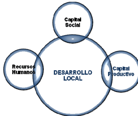
Figura 1: Desarrollo Local.

La Iniciativa Comunitaria LEADER es un claro ejemplo de un programa de actuación basado en las teorías de desarrollo local, con un peso considerable de los factores de innovación. Tanto LEADER I (1991-1994), como LEADER II (1994-1999) o LEADER+ son una Iniciativa Comunitaria de desarrollo rural, que busca experimentar enfoques de desarrollo rural autóctonos, locales e innovadores. La experiencia adquirida en LEADER I indica la adecuación de este enfoque, que permite a los agentes y a los territorios rurales revalorizar su potencial propio en el contexto de una política global de dinamización del desarrollo rural. Los objetivos de la Iniciativa Comunitaria LEADER II se concentran en tres: