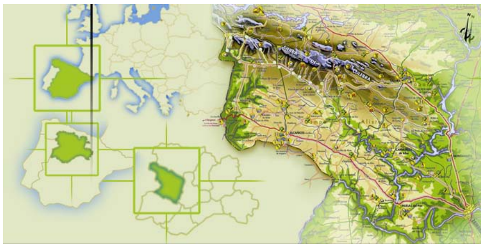
Figura 2. Zona de Estudio.

La Iniciativa Comunitaria LEADER ha resultado fundamental para la promoción del desarrollo de las zonas rurales. Con el objetivo de estudiar el impacto de esta Iniciativa vamos a tomar como referencia los territorios de Aliste, Tábara y Alba pertenecientes a la provincia de Zamora - España (Figura 2). Se hará referencia a los proyectos llevados a cabo a través del Grupo de Acción Local ADATA (Asociación para el Desarrollo de Aliste, Tábara y Alba).