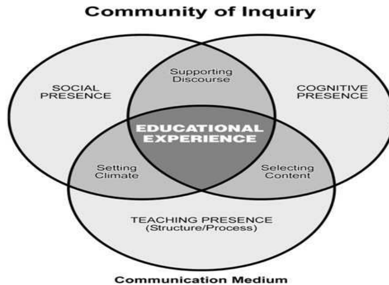
Figura 1 – Modelo de comunidades de inquirição

Este modelo coloca o enfoque na interdependência entre três dimensões: a social a presença cognitiva e a presença. A concepção de uma comunidade de aprendizagem online terá de ter em conta a correlação ideal entre elas para que a experiência educacional seja consumada. Estas três dimensões, como refere Dias (2008, p.6) “representam, o desenvolvimento das competências de análise dos conteúdos, o estabelecimento de um ambiente favorável à partilha das representações individuais num contexto colaborativo e (...) o papel do moderador na concepção e organização das actividades da comunidade.”