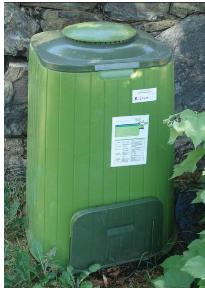
Compostor do Projecto Piloto de Compostagem Doméstica de Bragança.

A compostagem pode realizar-se a diversas escalas, dependendo do volume de resíduos recolhidos,