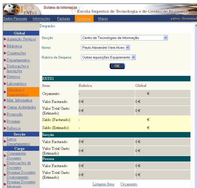
Fig. 2 – Interface da Intranet Domus.

A fig. 2 apresenta a interface do protótipo, onde se destaca o uso da cor como meio de informativo da navegação. Para melhorar os tempos de carregamento da intranet, a imagem da parte superior foi comprimida e dividida em quatro, conseguindo-se assim uma melhor performance.