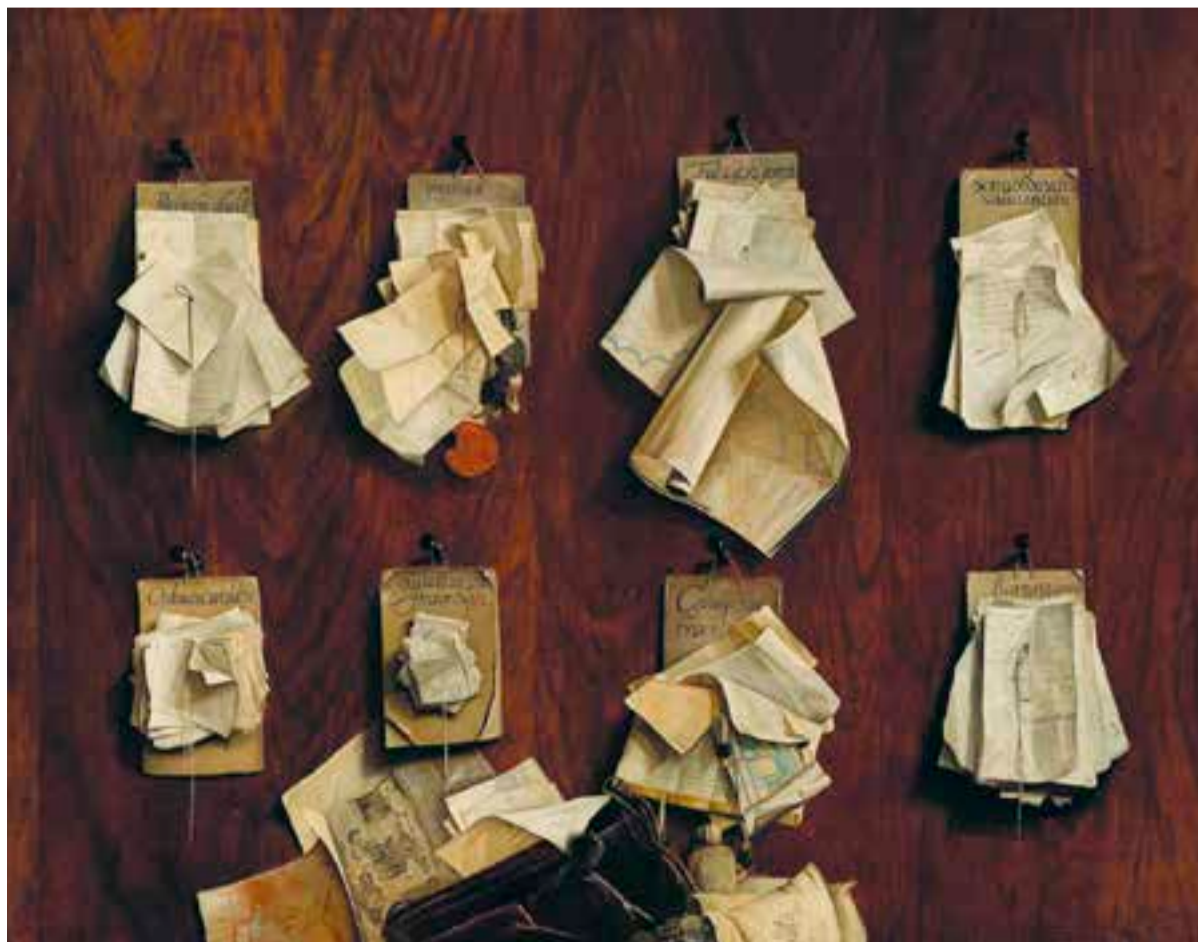
Schilderij met liassen van de Thesaurie Ordinaris der Stad Amsterdam, Cornelis Brizé, 1656