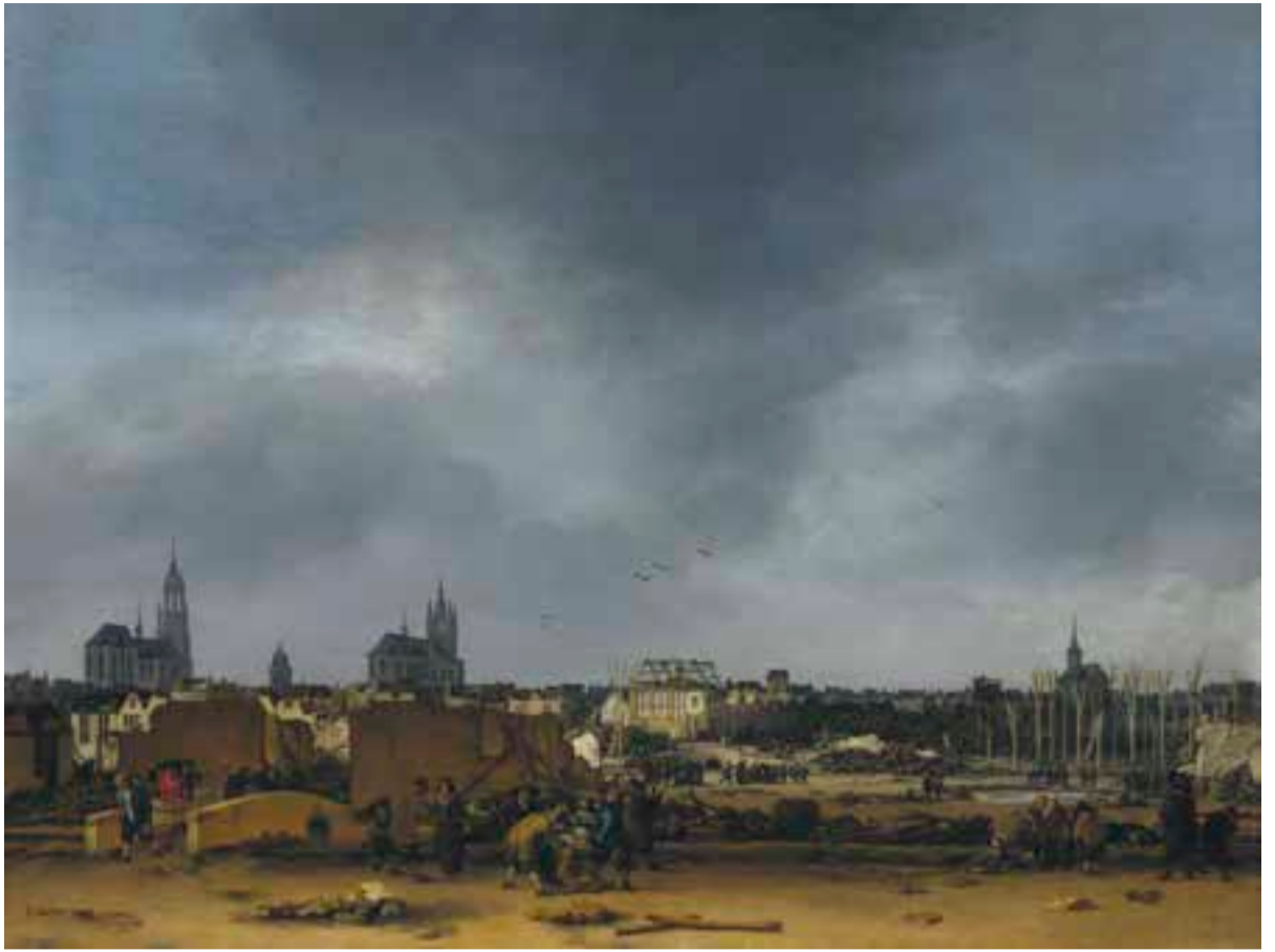
Gezicht op Delft na de explosie van 1654, Egbert Lievensz. van der Poel, 1654

Vandaag zijn papieren, hoewel inmiddels vaak digitaal, natuurlijk niet minder van belang dan in de tijd van Vondel – behalve aan geld denkt men ook aan documenten die iemand al dan niet (‘sans papiers’) een plek geven om te wonen en de erkenning die daar idealiter mee samengaat. De bijzondere actuele relevantie van Korstens historische analyse zit naar mijn gevoel vervat in die ene, aan het eind van de vorige paragraaf geciteerde zin. Ook al expliciteert de auteur het niet om de haverklap, The Dutch Republican Baroque gaat niet over de zeventiende eeuw op zich, maar over de zeventiende eeuw vandaag – over de lijnen die er te trekken vallen tussen ons verleden en ons heden, kwesties en problemen die toen aan de orde waren en dat nu nog steeds zijn: kwesties als de grenzen van de tolerantie, de slavernij die het kapitalisme in stand houdt (men breke het hoofd: wat is onderwerp, wat lijdend voorwerp?), de verhouding tussen daadwer-