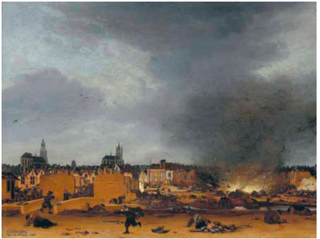
Gezicht op Delft tijdens de explosie van 1654, Egbert Lievensz. van der Poel, 1654

Exemplarisch voor de barokke zeventiende eeuw is de gebeurtenis waarmee Korstens boek opent: op 12 oktober 1654, een maandag, wordt Delft opgeschrikt door de ontploffing van het geheime buskruitdepot dat al sinds de vrede, die een halfjaar eerder