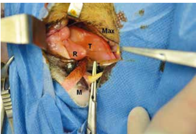
Figuur 3. Rechts lateraal aanzicht van open mond met steunhechting in het dak van de ranula (R). Onderzijde tong (T), maxilla (Max) en mandibula (M) worden weergegeven op de foto als oriëntatiepunten.

Faculteit Diergeneeskunde in Merelbeke (UGent) ter behandeling van een sublinguale intraorale zwelling rechts.