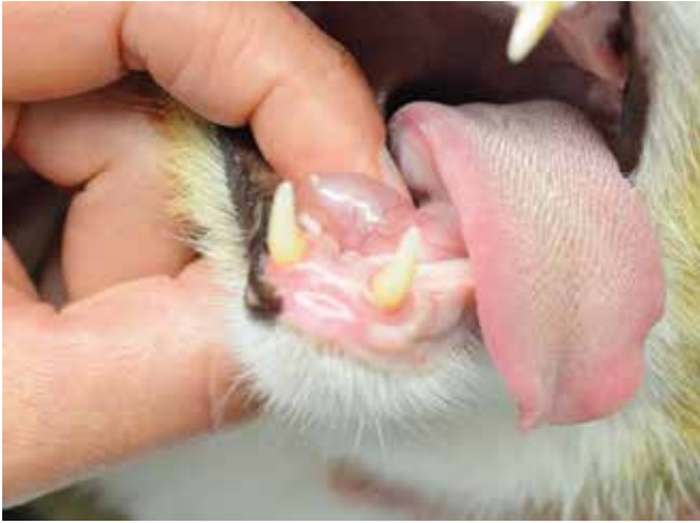
Figuur 1. Een zeven jaar oude, mannelijke, gecastreerde Europese korthaar werd aangeboden met een sublinguale zwelling aan de rechterkant.