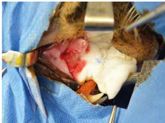
Figuur 4. Rechts lateraal aanzicht van open mond met een kompres ter absorptie van bloed en een steunhechting in de ranula. De volledige dikte van de sialocoelewand werd ingesneden.

Twee weken na de operatie werd de patiënt ter controle aangeboden. De eigenaars meldden dat de kat thuis alert was en het eten en drinken vlot verliepen. Ongeveer een week na de operatie werd er eenmalig een beetje bloed gezien in de muil. Tijdens het algemeen lichamenlijk onderzoek werden geen afwijkingen gevonden. Het operatielitteken ter hoogte