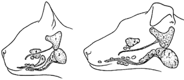
Figuur 5. Schematische voorstelling van de belangrijkste speekselklieren bij de kat (links) en de hond (rechts). 1. Parotis speekselklier; 2. Mandibulaire speekselklier; 3. Sublinguale speekselklier, pars monostomatica; 4. Zygomatische speekselklier; 5. Molare speekselklier. De niet-geïdentificeerde speekselklier gelegen rondom afvoergangen van sublinguale en mandibulair klieren is de sublinguale speekselklier, pars polystomatica (uit: Dunning, 2003).