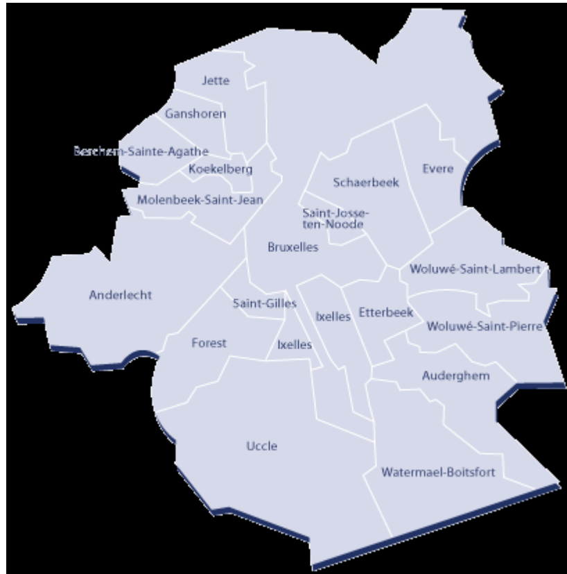
Figure 2 : Carte de Bruxelles -19 communes

Notons que Grand-Bigard n'est pas une commune bruxelloise mais qu'elle est située à l'ouest de Bruxelles, dans le brabant flamand. Si cette entrevue figure dans notre corpus, c'est que le locuteur est emblématique du parler bruxellois puisqu'il s'agit d'un chanteur populaire belge, identifié comme typiquement bruxellois. Il a d'ailleurs vécu longtemps dans le quartier populaire des Marolles.