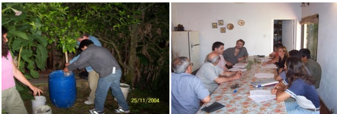
Figura 2. Ensayos participativos (2004).

En el segundo año del ensayo en la parcela, los resultados no fueron los esperados por el equipo técnico ya que el control sanitario propuesto no fue eficaz y en consecuencia las vides perdieron una buena parte del follaje y la uva no logró madurar. Si bien las bayas no tenían la calidad para hacer un vino tinto por la falta de color, se elaboró un vino espumante en las instalaciones de la FCAYF (2007) que impactó favorablemente para salvar el contenido de la propuesta de experimentación de los investigadores.