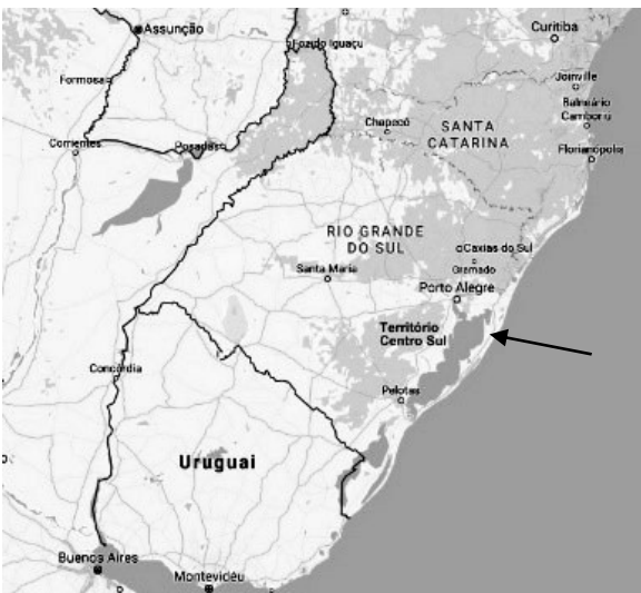
Figura 1: Mapa localização do território Centro Sul/RS.

Para essa análise foi escolhido como local de estudo o território rural Centro-Sul/RS localizado no eixo entre as cidades polos de Pelotas e Porto Alegre (Figura 1).