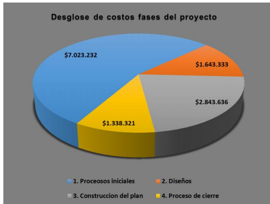
Gráfico 1. Desglose de costos por fases del proyecto.

Al desglosar los costos en los 4 paquetes o fase del proyecto descritos en la EDT se distribuyen de acuerdo al gráfico.