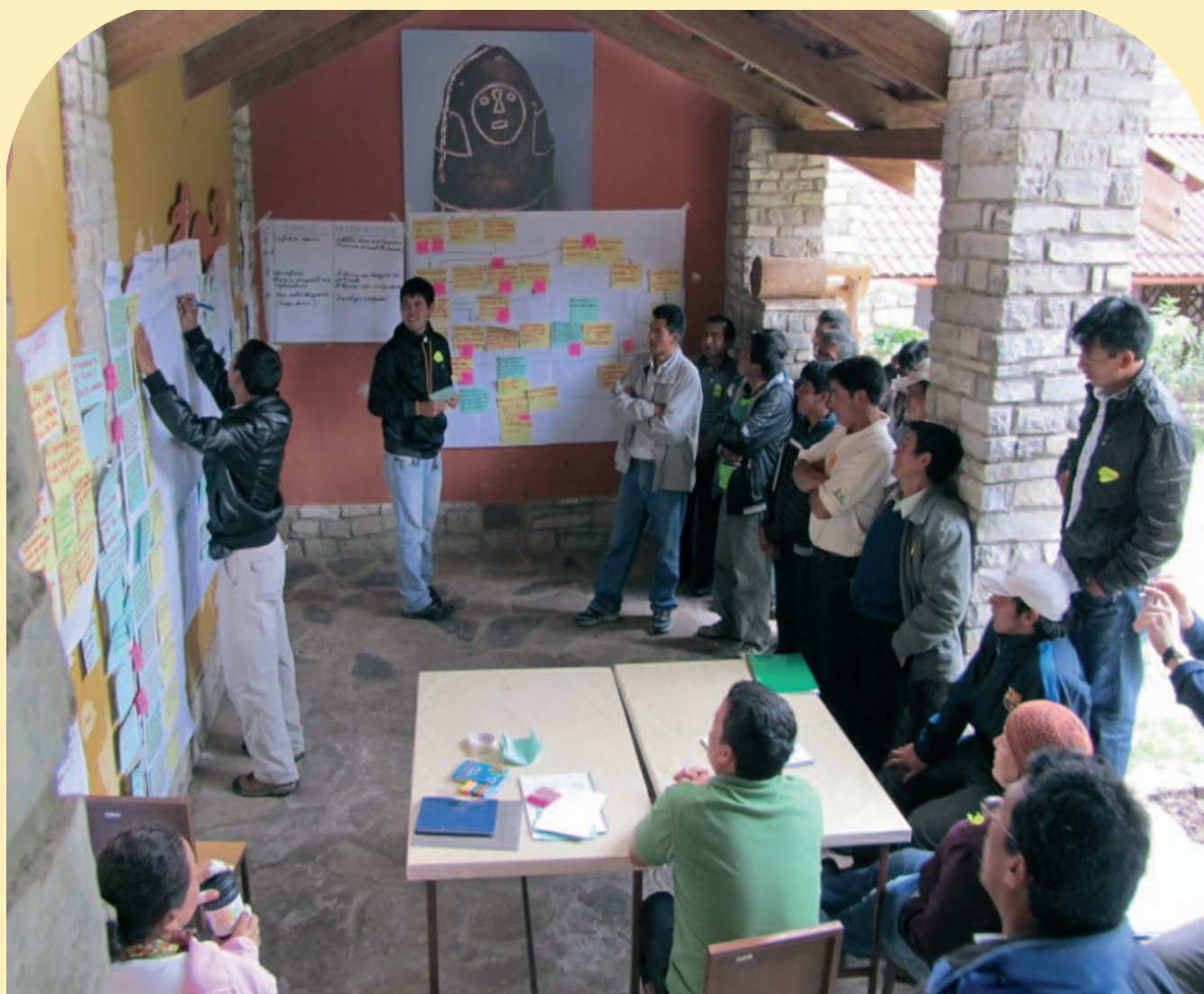
Foto 2: Taller participativo, Concesión de Conservación Alto Huayabamba

El interés de los usuarios se puede motivar de diferentes maneras, un ejemplo son los talleres participativos realizados en la Concesión de Conservación Alto Huayabamba (CCAH) con apoyo de la Alianza para el Clima, Comunidades, Biodiversidad (CCBA), otro son los foros accesibles a todos los actores afectados. En estos foros, deberán participar las comunidades con responsabilidades claras y permanentes durante todo el proceso de desarrollo e implementación y no sólo los líderes.