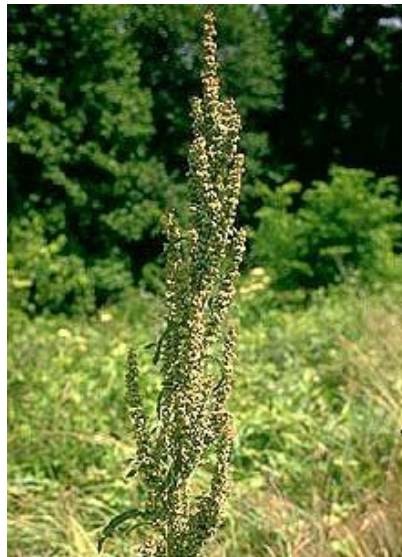
Figura 3: Rumex crispus L. (parte aérea).