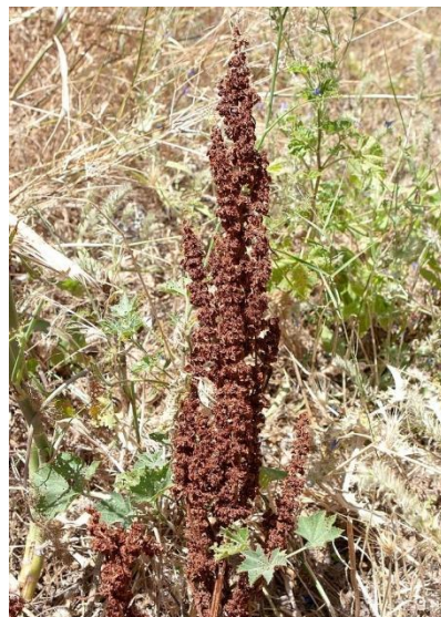
Figura 4: Rumex crispus L. (parte aérea madura).