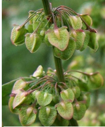
Figura 1: Rumex crispus L. (folhas e fruto)