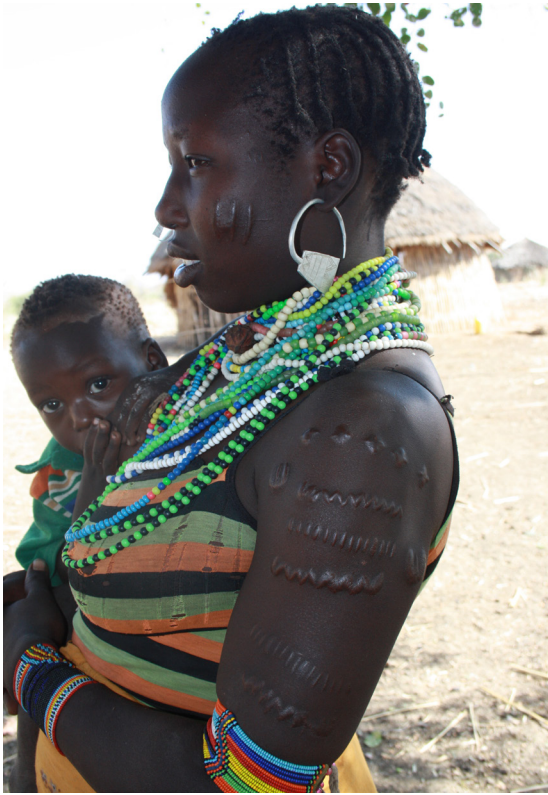
Figura 2. Mujer Gumuz, con escarificaciones, hilas de cuentas en cuello y brazos, y pendientes de níquel.