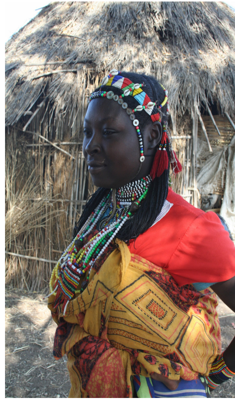
Figura 3. Mujer Dats'in con hilas de cuentas en el cuello y decoración en la cabeza..

minación de los grupos vecinos, habrían llegado a ocupar esta remota y difícil área de la frontera con Sudán, que ahora comparten bajo la incesante presión de sus vecinos más poderosos. Esta cercanía puede explicar la convergencia de rasgos culturales entre ambos, cuya causa solo podría discernirse con claridad si pudiéramos realizar trabajo de campo en el lado sudanés de la frontera, en donde no conviven con los Gumuz. De ahí que deba aclararse que ignoramos si varios de los rasgos que actualmente presentan en la zona de estudio son tradicionales u obedecen a procesos culturales recientes. En este momento, aparte del sistema socioeconómico, ambos grupos comparten innumerables rasgos culturales: el tipo de vivienda (aunque aún queda por estudiar la estructura interna del espacio doméstico, véase Falquina este volumen), la islamización que afecta a su mundo de creencias (mucho más evidente entre los Dats'in que entre los Gumuz, que aún mantienen claras prácticas animistas), el concepto de enfermedad y las prácticas de curación (realizada siempre por mu-