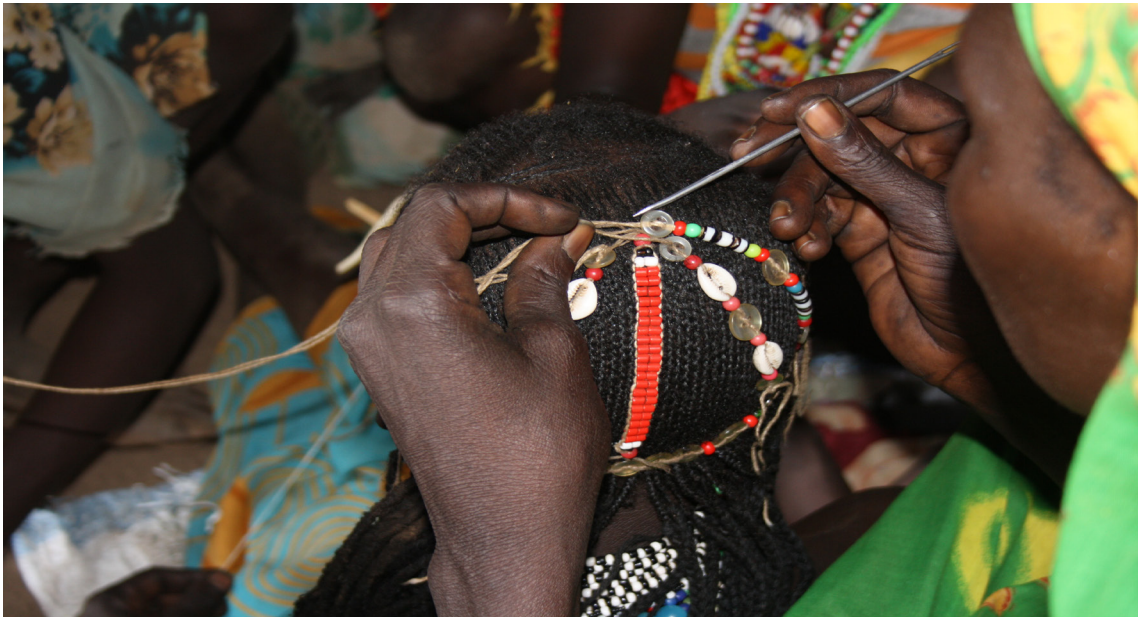
Figura 6. Proceso de decoración de la cabeza utilizando un ganchillo.