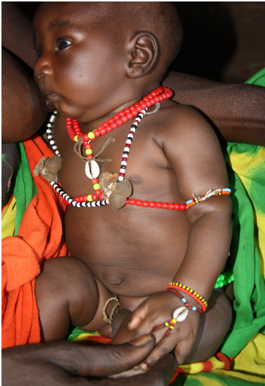
Figura 4. Bebé dats'in con hileras de cuentas alrededor de todo el cuerpo (también en cintura y tobillos), preferiblemente de color rojo.

fragmentos de conchas de río o de cáscara de huevo de avestruz constituían la materia prima de lo que más tarde pasaron a ser cuentas de vidrio o metal, y actualmente son de material plástico (Fisher 1984; Kepple 1986: 79). Al parecer, para los Shilluk cada color tenía un significado distinto, por lo que su combinación no era casual, sino que concitaba fuerzas y significados diferentes (Kepple 1986: 84). Esta diferencia en el efecto que produce cada color se mantiene hoy en el caso de las cuentas de color rojo, tanto entre los Gumuz como entre los Dats'in, color que se considera particularmente efectivo para conjurar el mal de ojo (según declaraciones de Mugacha, de Mahal Gerara y de Zernabbazu, de Tach Gerara), si bien todas las cuentas parecen compartir una función apotropaica, protegiendo a quien las luce de los riesgos que acarrea vivir. En prueba de ello, tanto entre los Gumuz como entre los Dats'in, cuando nace un bebé se le cubre inmediatamente con varias hileras de cuentas (en cuello, cintura, manos, tobillos...), entre las que domina el color rojo (Fig. 4). Sin embargo, en cuanto empiezan a andar, a los ni-