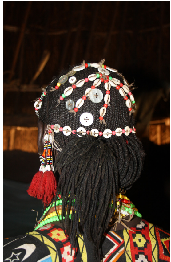
Figura 5. Un ejemplo de decoración de cabeza Dats'in.