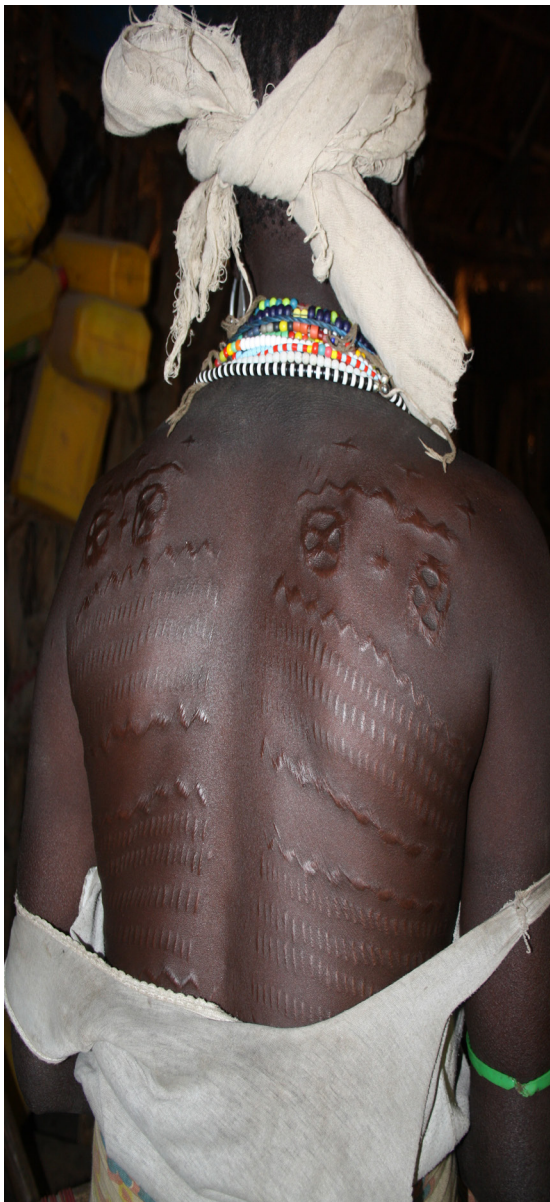
Figura 7. Mujer Gumuz con escarificaciones en la espalda.

nos abundantes. Podríamos pensar que se trata de un préstamo Gumuz, pero el hecho es que es más frecuente entre las mujeres de edad, no entre las jóvenes. Además, si tenemos en cuenta que las escarificaciones parecen remontarse al reino de Funj puede pensarse que tal vez también caracterizarían a los Dats'in, identificados como Hamej y sometidos a su dominación en el siglo XVI.