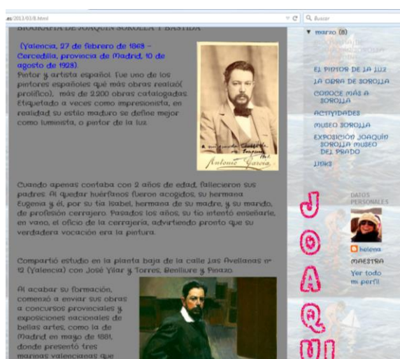
Figura 4.2: Hipervínculo del punto interactivo n.º 1