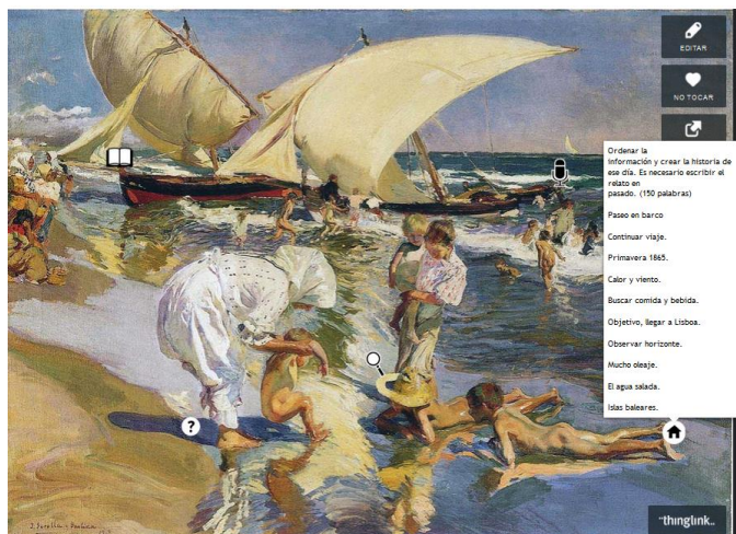
Figura 4.6: Punto interactivo nº 6