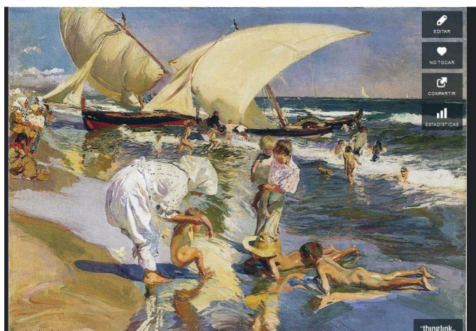
Figura 4.1: Proyección primera de «Playa de Valencia a la luz de la mañana»

puntos de la imagen. De esta manera, los alumnos trabajarán las diferentes destrezas comprendidas en el MCER .