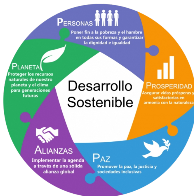
Figura 5: Seis elementos esenciales para el cumplimiento de los objetivos de desarrollo sostenible (Fuente: Naciones Unidas, 2014).

luchar contra las desigualdades; b) garantizar una vida sana, el conocimiento y la inclusión de las mujeres y los niños; c) prosperidad: desarrollar una economía sólida, inclusiva y transformadora; d) planeta: proteger nuestros ecosistemas para todas las sociedades y para nuestros hijos; e) justicia: promover sociedades seguras y pacíficas e instituciones sólidas; y f) asociación: catalizar la solidaridad mundial para el desarrollo sostenible. (Naciones Unidas, 2014).