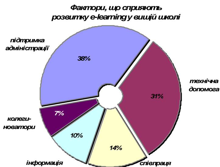
Рис. 2. Фактори, що сприяють просуванню e-learning у вищій школі (за результатами опитування)

Серед факторів, що сприяють просуванню e-learning у вищій школі, нашими респондентами названі (рис. 2): інформація (21%), співпраця (28%), колеги-новатори (10%). Проте найбільший відсоток набрали фактори, які можемо вважати знаковими для нашого університету, а саме — методична і технічна допомога (34 відсотки) та підтримка адміністрації (38 відсотків). Поштовхом до стрімкого розвитку електронного навчання в університеті став тренінг «Методика створення електронного курсу у системі MOODLE», проведений для співробітників ТНПУ викладачами кафедри інформатики і методики її викладання.