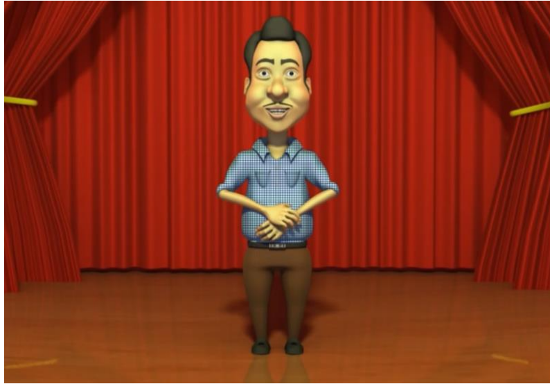
Rajah 3: Reka bentuk karakter Ramlee 3 dimensi.