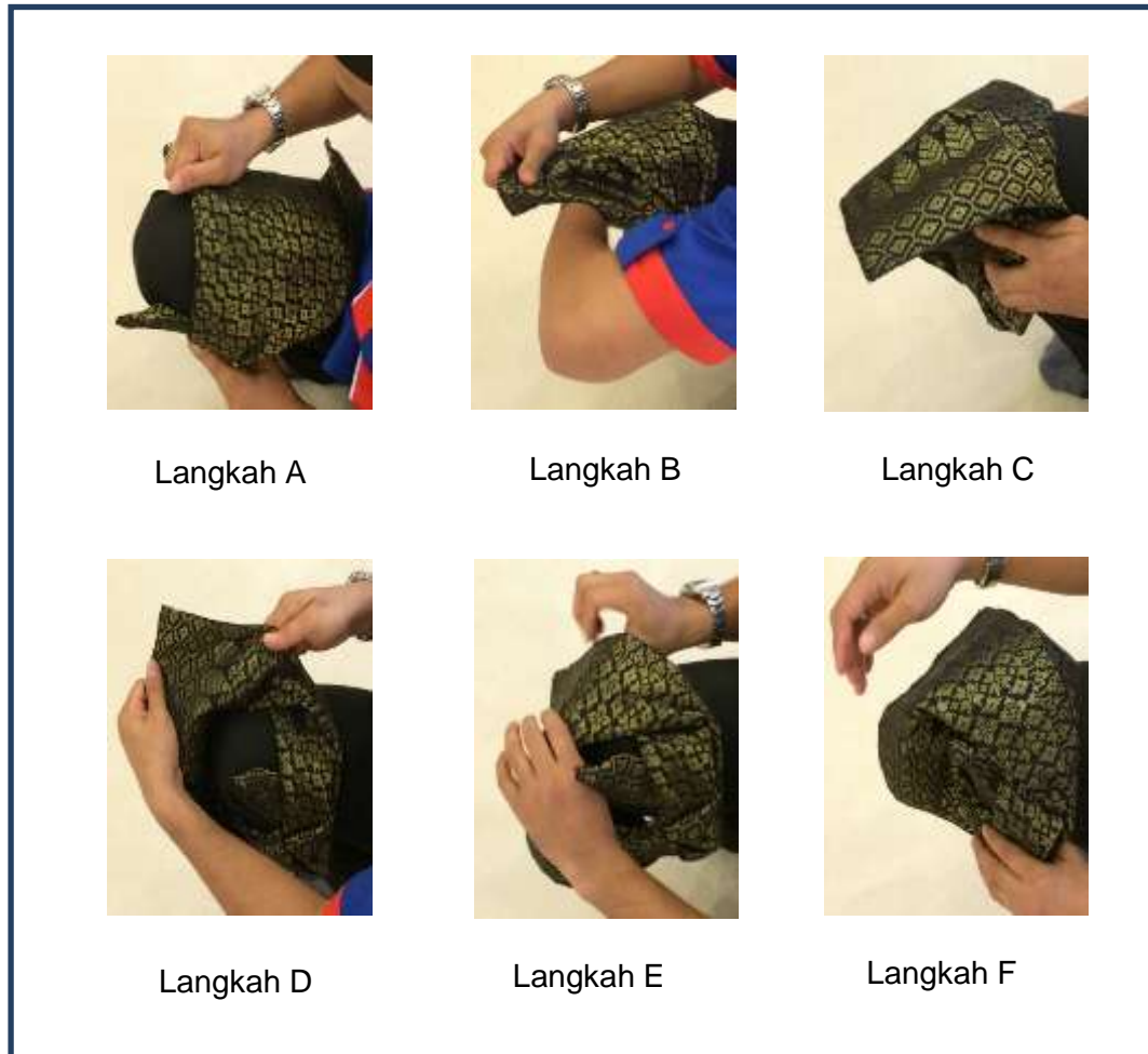
Gambar 3: Bahagian Ketiga, Solek.

Gambar 4 adalah reka bentuk tengkolok yang dihasilkan daripada teknik lipatan tengkolok yang dinyatakan di atas. Begitu indah reka bentuk tengkolok Ayam Patah Kepak negeri Perak DarulRidzuan.