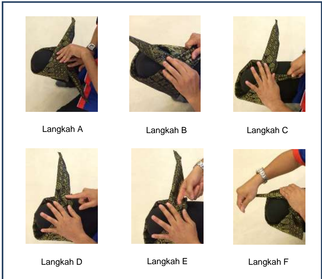
Gambar 2: Bahagian Kedua, Simpul

ditarik bagi mengemaskan simpulan yang telah dibuat. Setelah itu, lipat dan masukkan ke dalam. Maka pucuk rebung akan terhasil seperti gambar Langkah F.