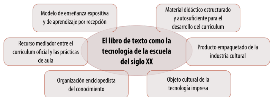
Figura 1. El libro de texto como tecnología dominante de la escuela del siglo XX.

En otra ocasión (Area y González, 2015) planteamos que los libros de texto representan la tecnología más genuina de la escuela del siglo XX basada en la educación en masa en función de seis rasgos caracterizadores de este material didáctico (Figura 1).