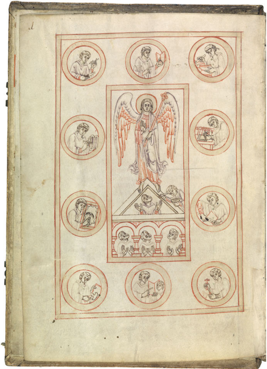
Abb. 3: Die Buchmanufaktur des Klosters Michelsberg in Bamberg (Msc. Patr. 5, fol. 1v).