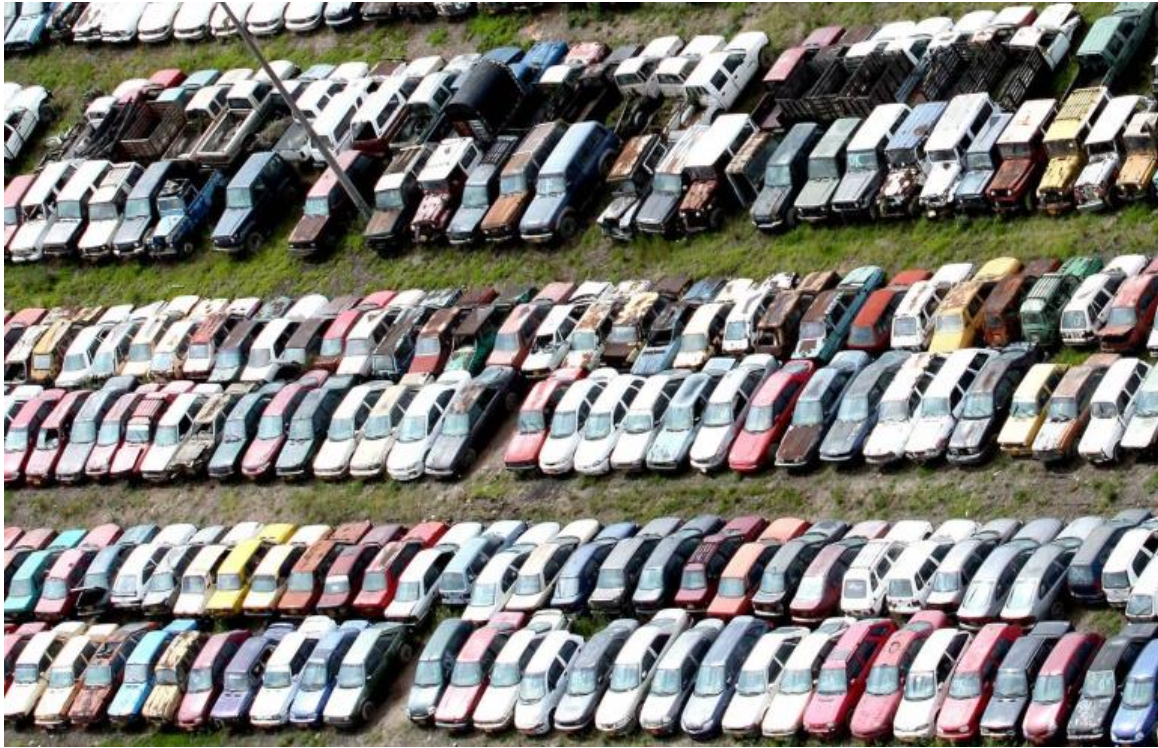
La figura 4: muestra los vehículos abandonados en los patios de la ciudad de Bogotá.

Sin embargo la solución que ofrece el distrito “enajenar o rematar” no sería la solución más óptima; en principio por que se desconoce el estado mecánico y el grado de deterioro de los vehículos “los 17.000 que son susceptibles de declararse en abandono” lo cual hace poco atractivo su compra.