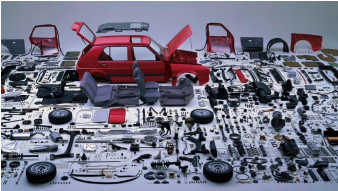
Figura 2: automóvil y sus partes

En la figura 2 muestra las partes que componen un vehículo básico en donde el 85% es posible reciclarlo.