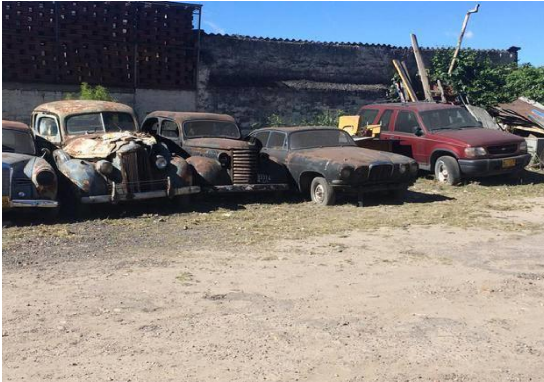
En la figura 2 muestra vehículos abandonados en un lote en el centro de Bogotá carrera 8 entre calles séptima y octava.

hacer referencia a los antecedentes del comercio de automóviles nuevos y usados en el mundo, mencionando el parque automotor con el que cuentan algunos países y su relación con la antigüedad del mismo, es necesario puesto que ayuda a vislumbrar los datos sobre el parque automotor colombiano y su relación con la antigüedad de estos y las consecuencias que trae el consumo masivo que ha tenido los automóviles en la historia contemporánea, además se hace referencia al reciclaje de los vehículos y las políticas que se están tomando en algunos países de Europa y de América del Norte como lo es Estados Unidos quienes van marcando las directrices del reciclaje de vehículos.