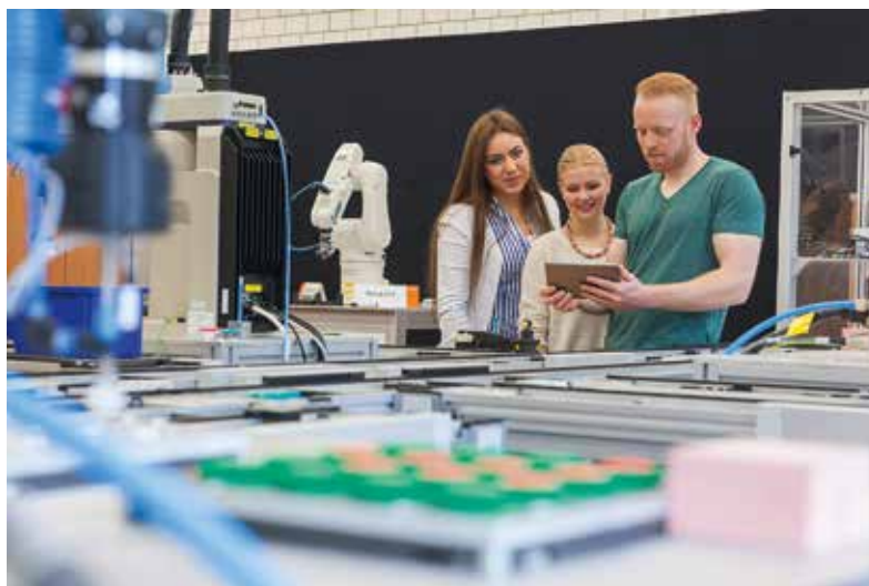
Mit 30 Studierenden startet zum kommenden Wintersemester der Studiengang Produktions- und Servicemanagement.