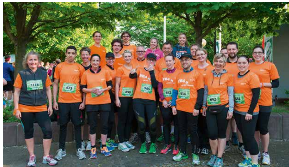
Beim Dortmunder Campuslauf am 20. Mai 2015 war das Team der Fachhochschule Dortmund mit Spaß, guter Laune und großer Laufstärke dabei. Mit Erfolg: Die Fachhochschule stellte das Team mit den meisten Finishern.