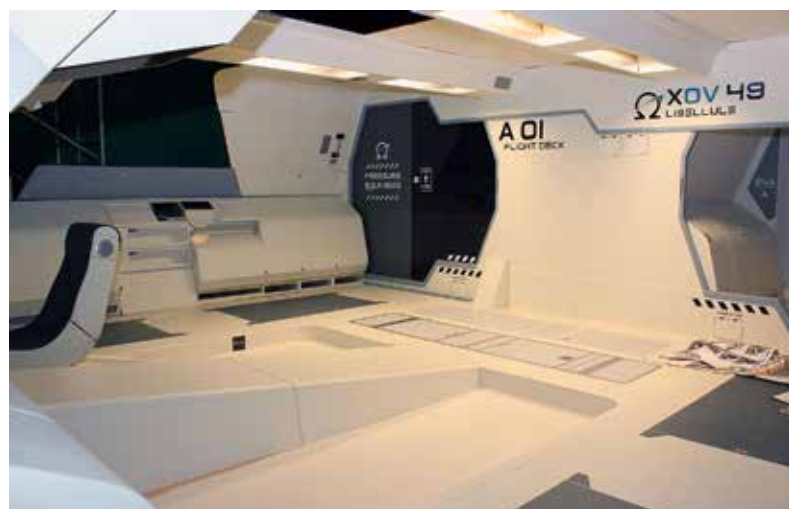
Ein besonderer Blickfang war das in vielen Arbeitsstunden gebaute Filmset „Omega“, das für einen Kinderfilm genutzt wird.

Ein ganz besonderer Blickfang im Filmstudio war dabei das Filmset „Omega“, das vier Studierende derzeit unter der Regie von Lennart Oberscheidt als gemeinsame Bachelorarbeit realisieren. Ein Riesenprojekt: Mehr als 2000 Stunden hat das Team, unterstützt durch viele helfende Hände, bereits investiert. Unmittelbar nach der Ausstellung ging es im Filmstudio der Fachhochschule Dortmund erst richtig los: Drei Wochen lang wurde am Filmset Omega ein 25-minütiges Remake eines Kinderfilms gedreht, der irgendwo in den unendlichen Weiten des Weltraums an-