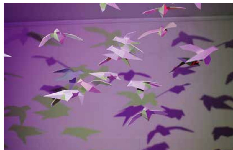
„Low Poly Light“ ist eine Objektinstallation aus low poly Möwen, die einen besonderen Effekt durch Farbe, Licht und Schatten erzielt.

Wand. Durch die additive Farbmischung entstehen auf Möwen und Schatten unterschiedliche Farben, dazu hört man Klänge, die sich am Rauschen des Meeres orientieren. Wanduhren aus ungewöhnlichen Materialien oder originelle Handy-Halterungen entstanden im Seminar „Modellbau Grundlagen“ für Erstsemester. Ein gelungenes Beispiel für Upcycling ist etwa René